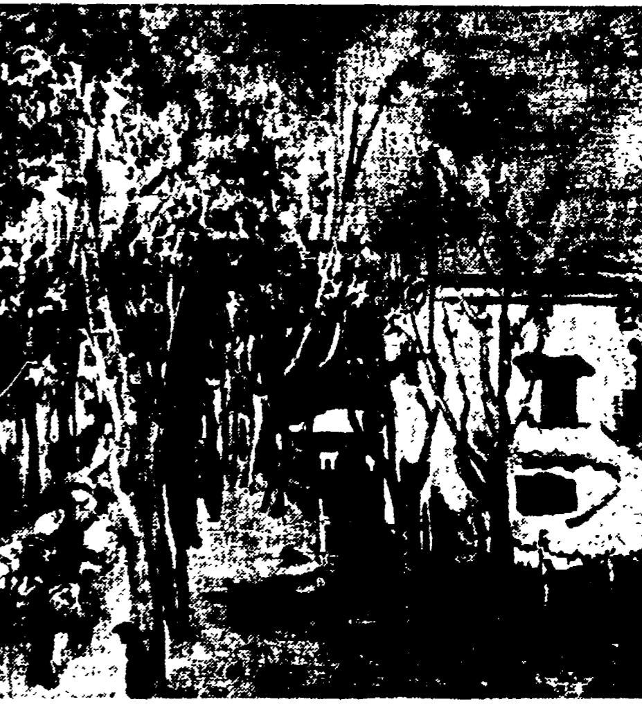
Fra i regali portati al Congresso dai compagni della Federazione comunista romana si trova questo quadro, già esposto alla XXV Biennale, che il pittore Giovanni Omiccioli ha offerto in dono a Togliatti