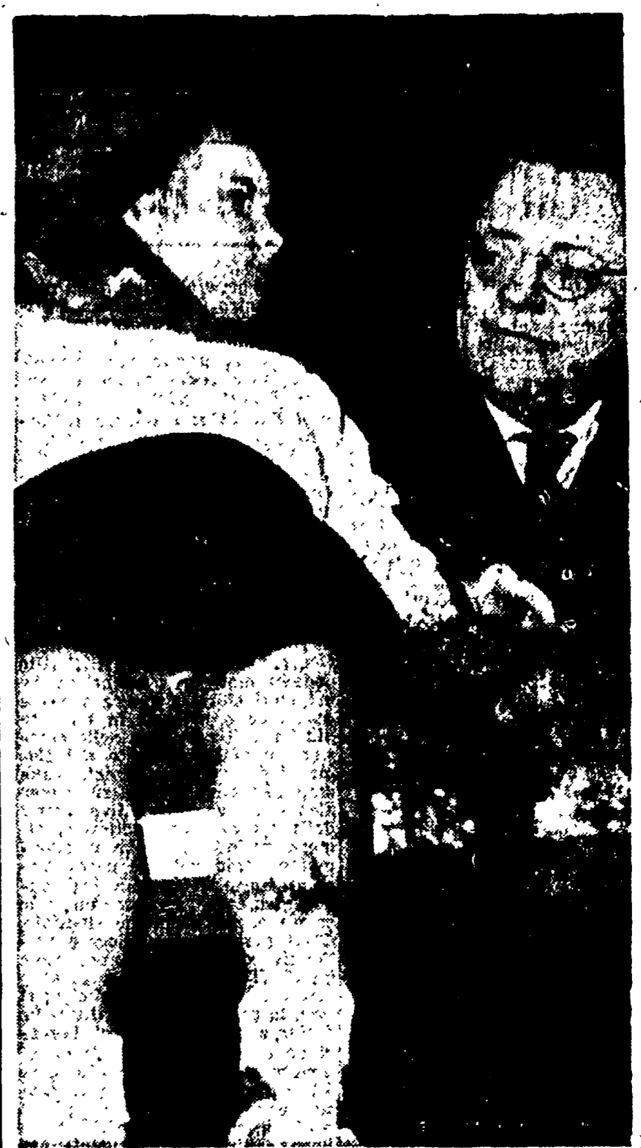
I bambini e le bambine dell'Associazione Pionieri hanno portato una nota particolare di galetta e di entusiasmo nel Congresso del comitato italiano. Le loro voci e i loro gesti, i piccoli discorsi coi quali hanno dato notizia all'assemblea delle conquiste raggiunte e di quelle da raggiungere per il benessere di tutti i ragazzi d'Italia, hanno riscosso l'unanime, affettuoso plauso dei delegati e degli spettatori. Nella foto: una bimba dell'Associazione Pionieri siede sul tavolo della presidenza del Congresso accanto al compagno Togliatti

Un avvenimento memorabile che sarà segnato sul "giornale di bordo." Le importanti realizzazioni dell'A.P.I. - Inni nuovi e compiti nuovi