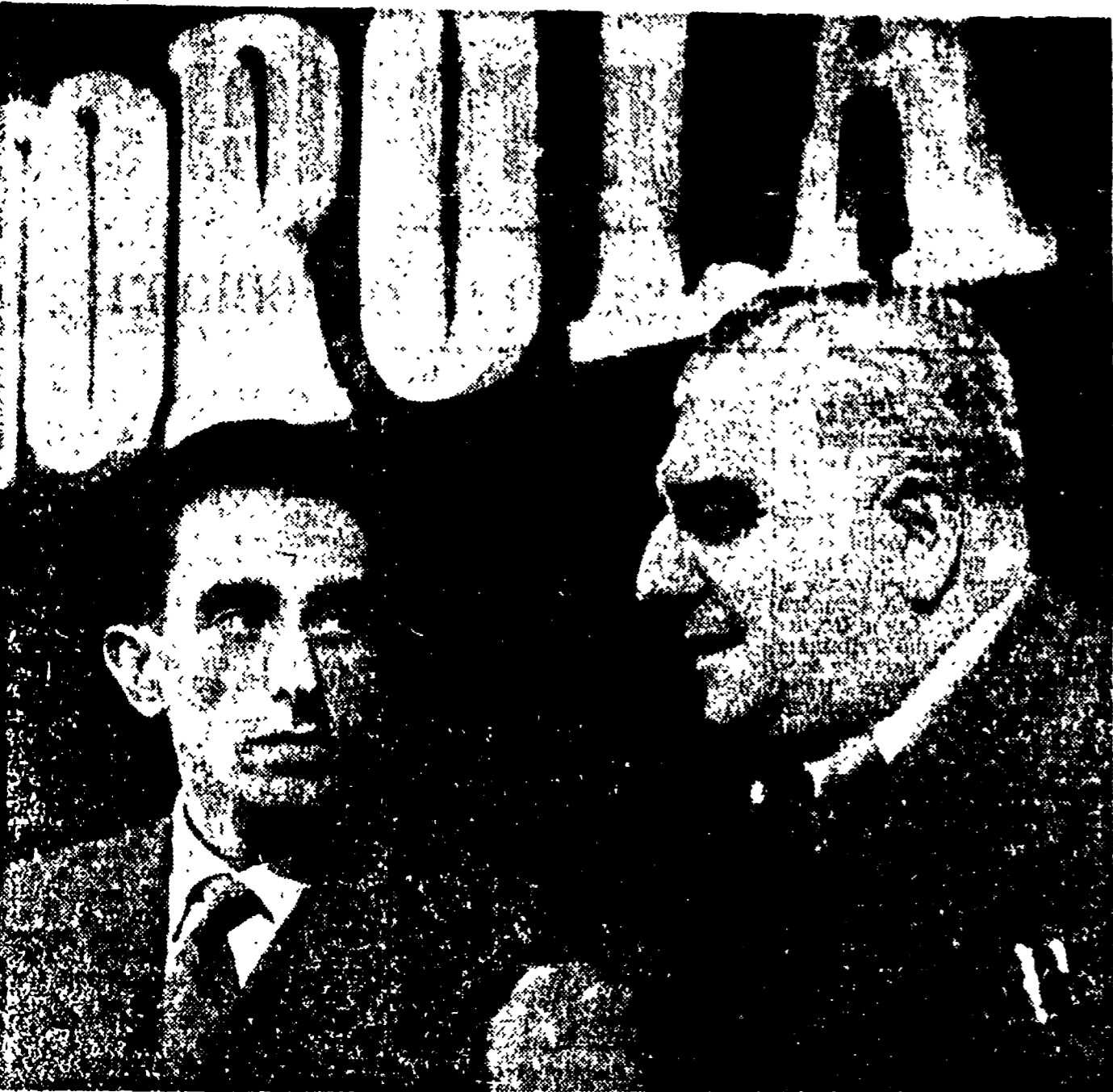
Il compagno Dozza (a destra), Sindaco di Bologna e membro del C. C. del Partito