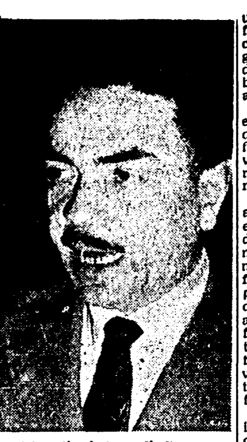
Adamoli, sindaco di Genova

Non si discute in piedi, applaude lungamente il compagno Gullo. A questo punto il compagno Colombi sottopone all'approvazione del Congresso la lista dei componenti la Commissione elettorale, che viene approvata per acclamazione.