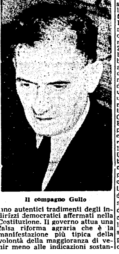
Il compagno Gullo

Qui Gullo compie un'ampia analisi dell'azione governativa tendente a non emanare le leggi di attuazione della Costituzione o a emanarle, quando si decide a farlo, in modo tale da snaturare quello che avrebbe dovuto essere il contenuto politico e sociale previsto dagli articoli costituzionali.