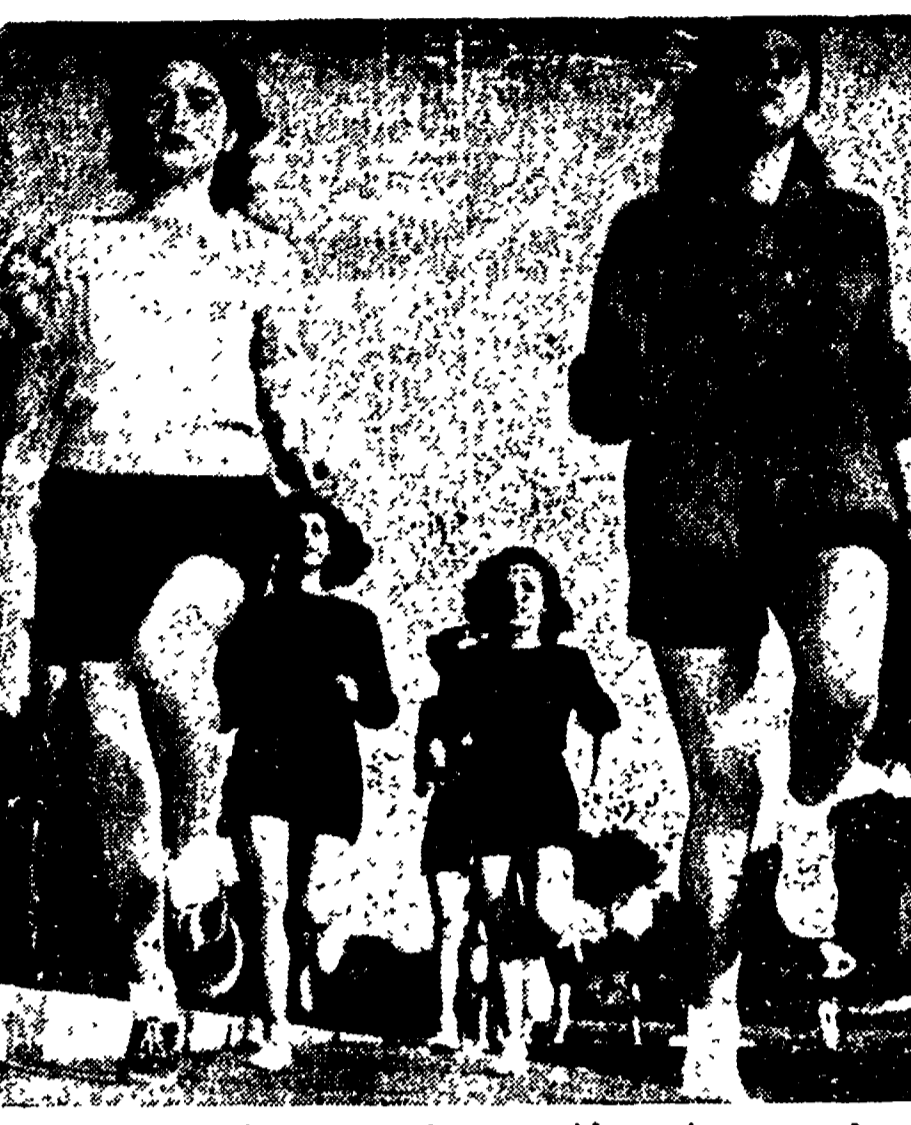
Le ragazze sportive romane si stanno attivamente preparando per l'incontro di Primavera...