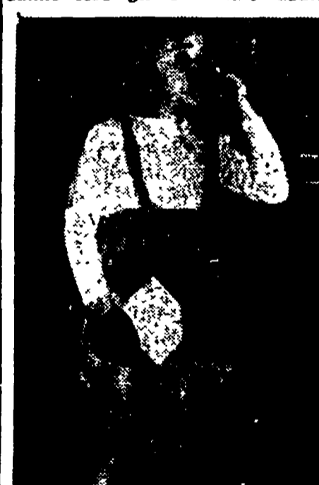
Cipollino, l'eroe dei Pionieri, ha una simpatica rappresentazione...