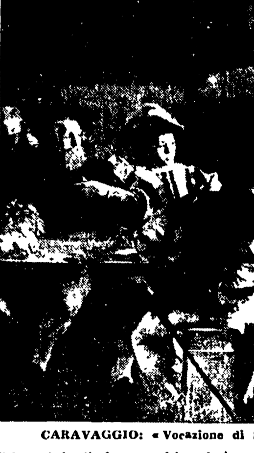
CARAVAGGIO: «Vocazione di S. Matteo» (particolare)

la Vocazione di S. Matteo e il Martirio di S. Matteo. Occorre descrivere la prima di queste due, che fa parte dei sommi capolavori di ogni tempo. Matteo è sorpreso dal Cristo mentre gioca in un locale dall'aspetto di taverna, insieme con un vecchio e con due giovanotti. Il Cristo, leggero come un fantasma, si avvicina al tavolo allungando lentamente la destra, della quale pendono una scure e un coltello.