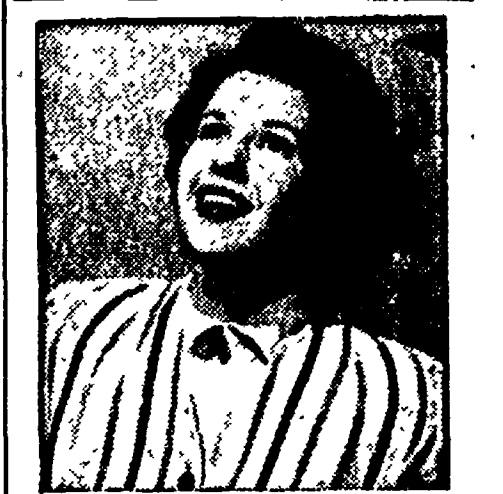
SORRIDETE DURBAN'S «4216 Dentisti consigliano l'uso dell'Effetto Durban's per la efficace scientifica del suo prodotto componente l'Overfax».