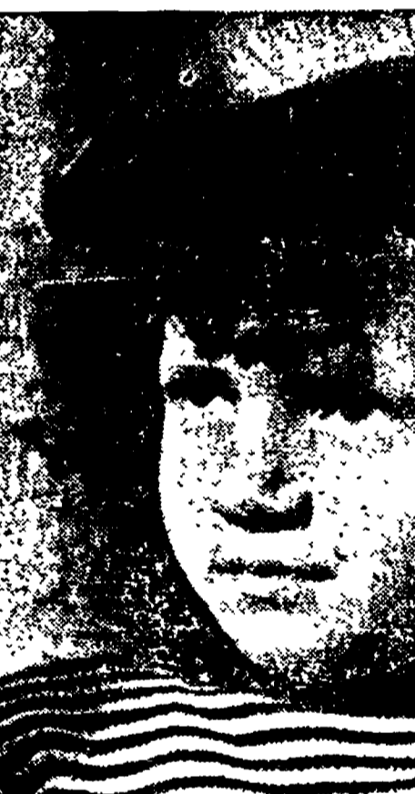
La primavera riporta la gioia negli occhi dei bambini

Dove vanno i ragazzi? - Dal cortile al giardino pubblico. Lo spirito di emulazione e l'invidia per gli "assi", dello sport