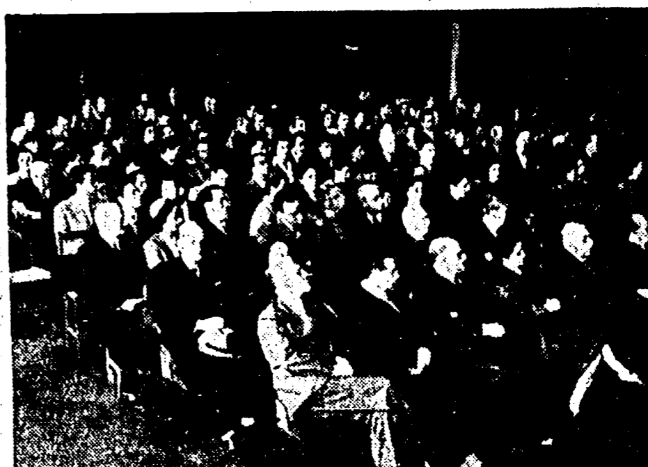
Un aspetto della sala di Palazzo Vecchio durante lo svolgimento dei lavori del Convegno sul tema «Scuola e guerra»

Pubblichiamo la risoluzione votata al termine del Convegno «Scuola e Guerra» tenutosi a Firenze: Il Convegno «Scuola e Guerra» promosso dall'A.I.S.N., constatato, attraverso relazioni e numerosi interventi di uomini di scuola e di scienza, l'indebita tendenza, le devastazioni materiali e morali causate alla scuola italiana da un quarantennio di guerra — e cioè, l'arretratezza dell'edilizia scolastica e il ristagno del suo sviluppo, l'aggravamento delle condizioni sanitarie e del disagio morale e psichico della nostra infanzia e della nostra gioventù, l'indebolimento delle tradizioni di umanità e di tolleranza ereditate dal nostro Risorgimento e, constatata altresì, l'esistenza di preoccupazioni e di ansie che tuttora ostacolano la concordata opera di ricostruzione, riafferma la volontà di lottare per la libertà dell'insegnamento e la responsabilità dello Stato nella organizzazione e direzione della scuola, principi sanciti dalla Costituzione della Repubblica, e garanzia fondamentale per una vasta opera