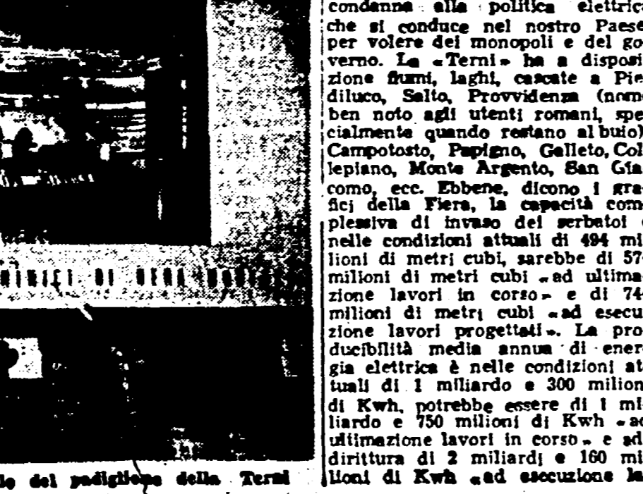
MILANO — Un aspetto parziale del padiglione della Terni

«Terni» non hanno che suonare condanna alla politica elettrica che si conduce nel nostro Paese, per volere dei monopoli e del governo. La «Terni» ha a disposizione fiumi, laghi, cascata Piediluco, Sella, Providenza (nome ben noto agli utenti romani, specialmente quando restano al buio), Campotosto, Cellole, Celio, Cappelano, Monte Argento, Eno, Ciacone, ecc. Ebbene, dicono i grafici della Fiera, la capacità complessiva di invaso dei serbatoi è nelle condizioni attuali di 494 milioni di metri cubi, sarebbe di 574 milioni di metri cubi ad ultimazione lavori in corso — e di 744 milioni di metri cubi ad esecuzione lavori progettati. La produttività media annua di energia elettrica è nelle condizioni attuali di 1 miliardo e 300 milioni di Kw/h, potrebbe essere di 1 miliardo e 750 milioni di Kw/h ad ultimazione lavori in corso, e addirittura di 2 miliardi e 160 milioni di Kw/h ad esecuzione la-