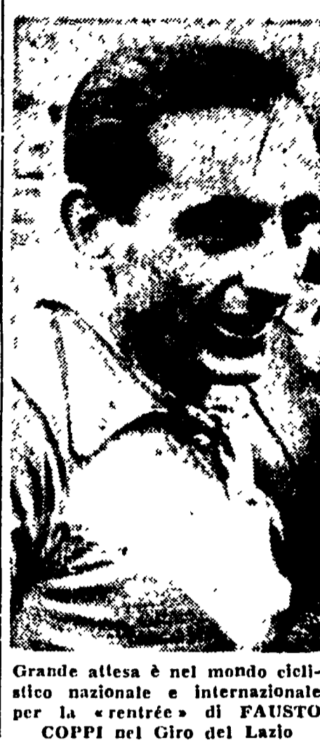
Grande attesa è nel mondo ciclistico nazionale e internazionale per la partenza di FAUSTO COPPI nel Giro del Lazio

Genoa gioca a Bologna le penultime, residue speranze di salvezza; diciamo penultime, ma siamo convinti che si tratta proprio delle ultime.