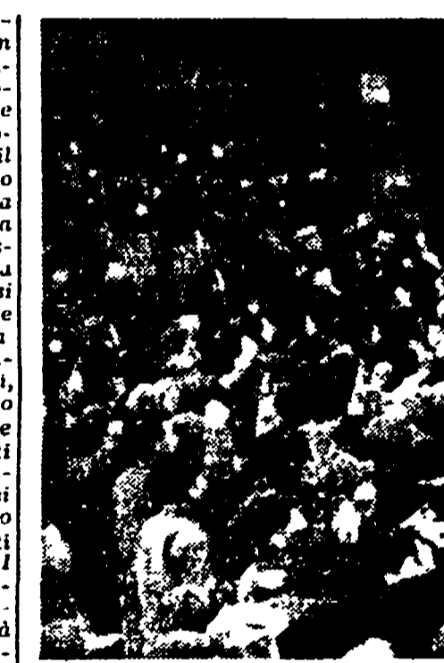
PECHINO - Universitari cinesi volontari in Corea vengono festeggiati dai loro colleghi

Sui tetti bassi delle case, a Pechino, l'alba portava, invece di un sole splendente, un cielo grigio e umido come un panno bagnato.