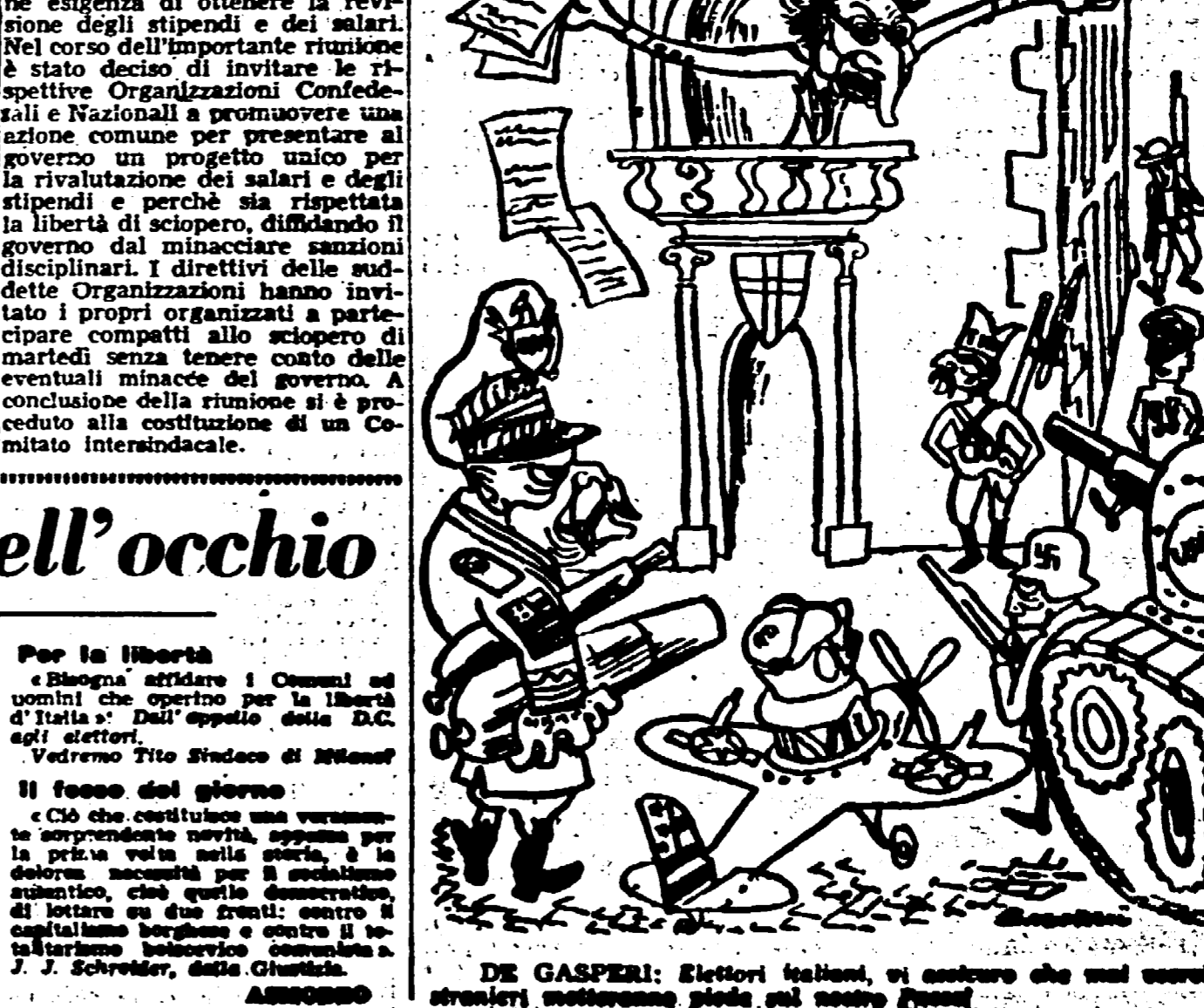
DE GASPERI: Elettori italiani, vi accorgete che una corrotta stranieri, moltiplicano piedi sul vostro paese?