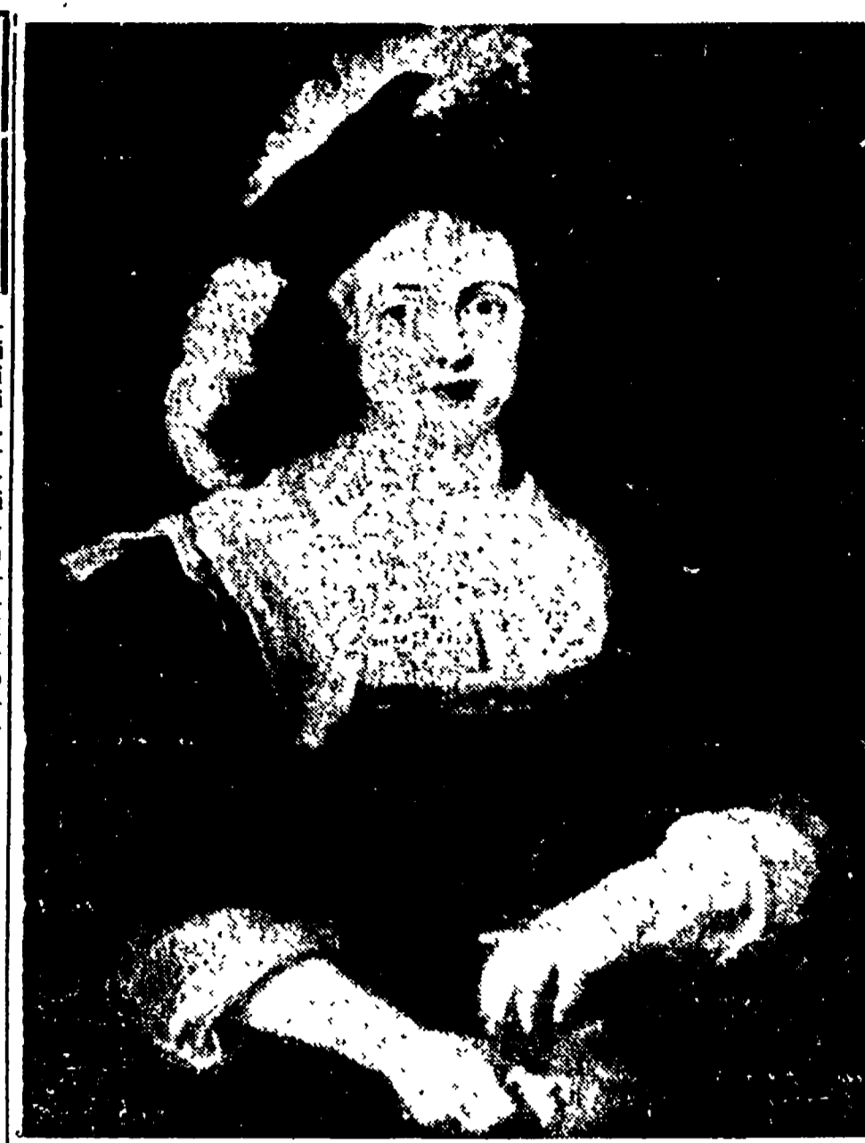
P. P. RUBENS: Ritratto di Elena Fourment