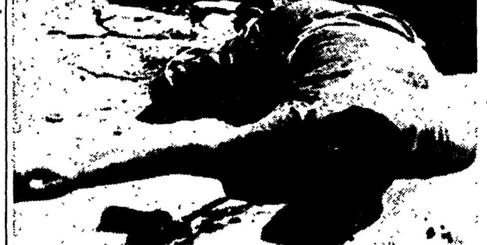
Giuliano non sapeva che affidando a quel certo avvocato il memoriale che fu portato a Viterbo, firmava la sua sentenza di morte.

TEHERAN, 3. - Il nuovo primo ministro dell'Iran, Mohammed Mossadek, ha oggi esposto alla Camera il programma del nuovo governo.