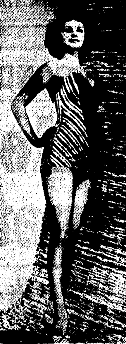
INVITO AL BAGNO: ieri il termometro segnava 28 gradi all'ombra

Il bilancio del 1947, che ha un deficit di 1.100 miliardi, è stato approvato con un voto di 11 contro 10. Il bilancio del 1948, invece, è stato respinto con un voto di 11 contro 10.