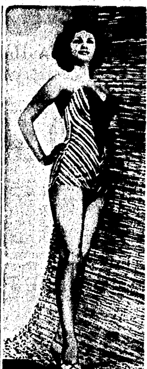
INVITO AL BAGNO: ieri il termometro segnava 28 gradi all'ombra