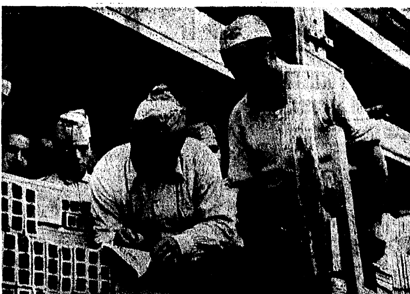
La raccolta delle firme in calce all'Appello di Berlino per un incontro fra i Cinque Grandi ha assunto un particolare sviluppo tra i lavoratori edili romani...