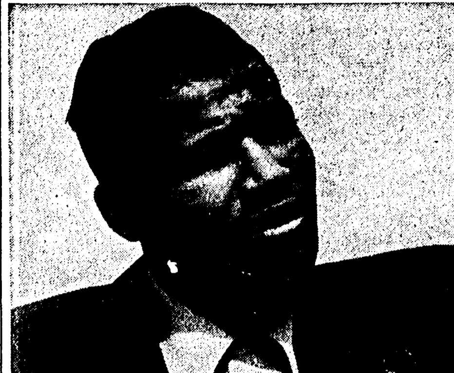
RAY ROBINSON ha firmato l'Appello di Berlino per un patto di pace tra i Cinque Grandi...