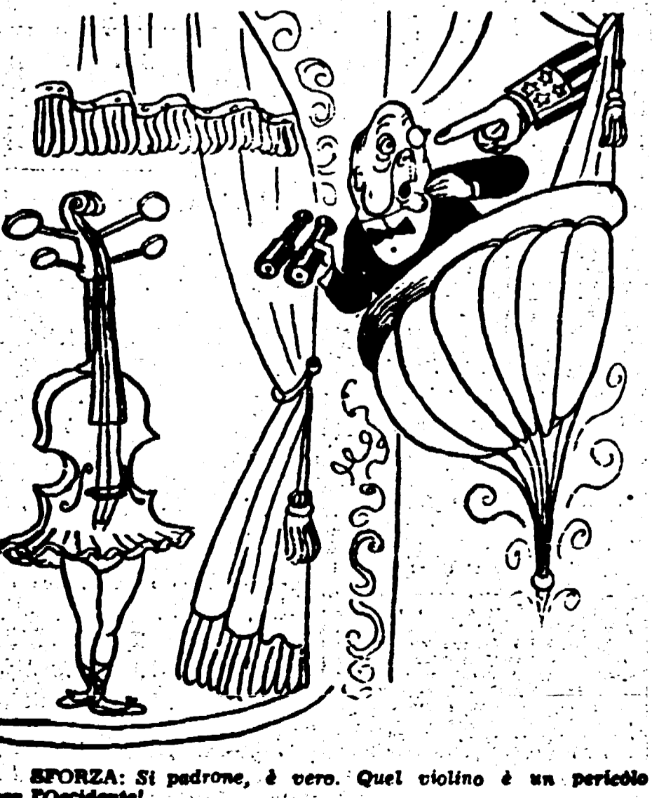
SFORZA: Si padrone, è vero. Quel ciolino è un pericolo per l'Occidente!

Ma questa chiara dimostrazione non convince il Presidente Martino il quale insiste nell'invitare la Camera ad esprimere un voto sulla cessione del compagno Laconi mentre tutta l'Opposizione in piedi protesta energicamente.