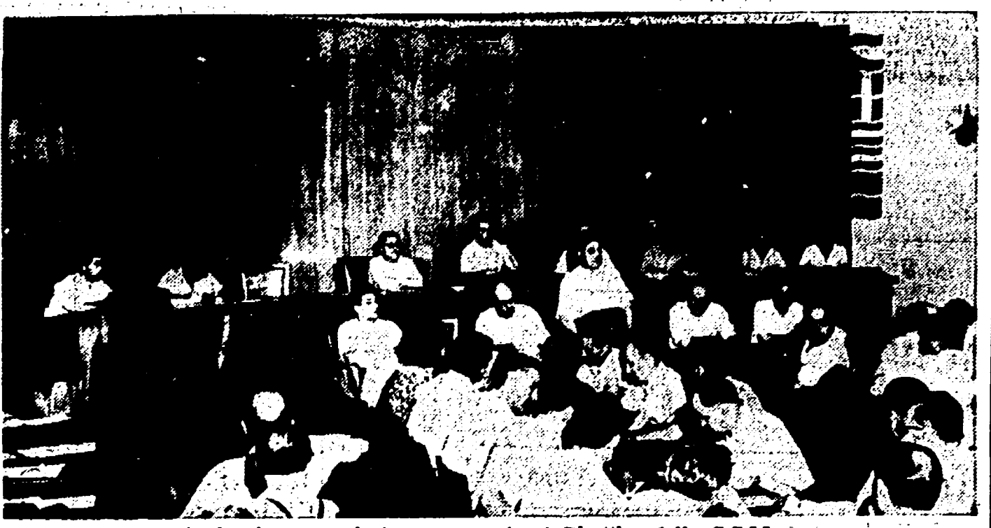
Di Vittorio pronuncia il suo rapporto al Direttivo della C.G.I.L.

Con la relazione del compagno Giuseppe Di Vittorio sulla situazione economica e generale del Paese in rapporto al tenore di vita dei lavoratori hanno avuto inizio ieri sera i lavori del Comitato direttivo della CGIL. L'approfondita analisi del segretario della Confederazione Generale del Lavoro ha affrontato nella prima parte la grave crisi che investe tutti i settori della vita nazionale. Le tre cause principali della profonda depressione, la cui persistenza è un fattore di continuo peggioramento, sono state indicate dal compagno Di Vittorio: 1) nella crisi di tutti i settori dell'industria con la conseguenza dell'organico impoverimento dell'intero sistema produttivo; 2) nel basso livello di vita delle masse popolari in conseguenza essenzialmente della grave disoccupazione che affligge il nostro Paese; 3) nell'aumento del costo della vita, con la conseguenza di una conseguente riduzione degli investimenti produttivi.