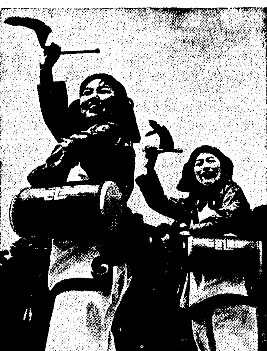
CINA - La delegazione cinese sarà composta da giovani rappresentanti di tutte le categorie sociali e da forti squadre culturali e sportive. Grandi feste della gioventù si stanno svolgendo in tutto il Paese in preparazione del Festival con l'entusiastica partecipazione popolare.

Ma che fanno per la pace i giovani in Italia? Al Festival di Berlino, si sono preparati e si stanno preparando, si, con iniziative che dovranno mostrare le capacità artistiche e