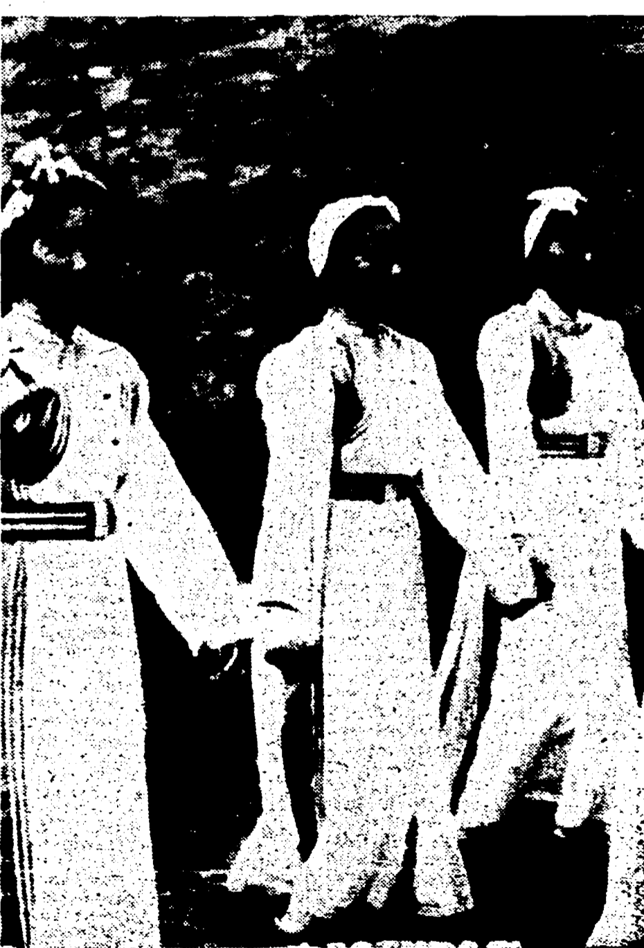
COREA - Nonostante le spaventose ferite procurate al proprio Paese dall'aggressione americana i giovani coreani parteciperanno al Festival per chiedere ai giovani di tutto il mondo di vigilare e di lottare perché dalla loro terra cessi mai la pace.