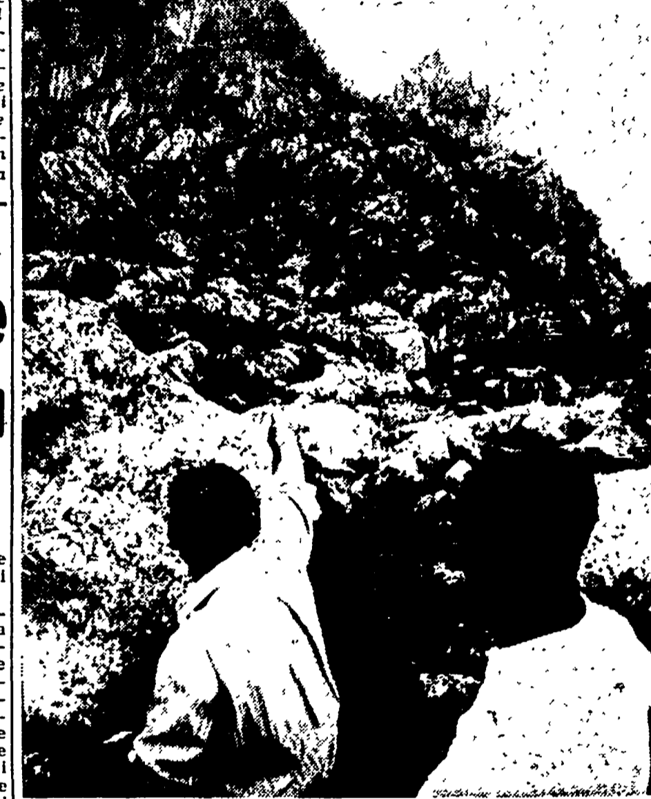
Ecco la riemersione celebre «Monna Pizuta» da dove partirono le fatiche del mitra che stronca non la vita a quattordici contadini...