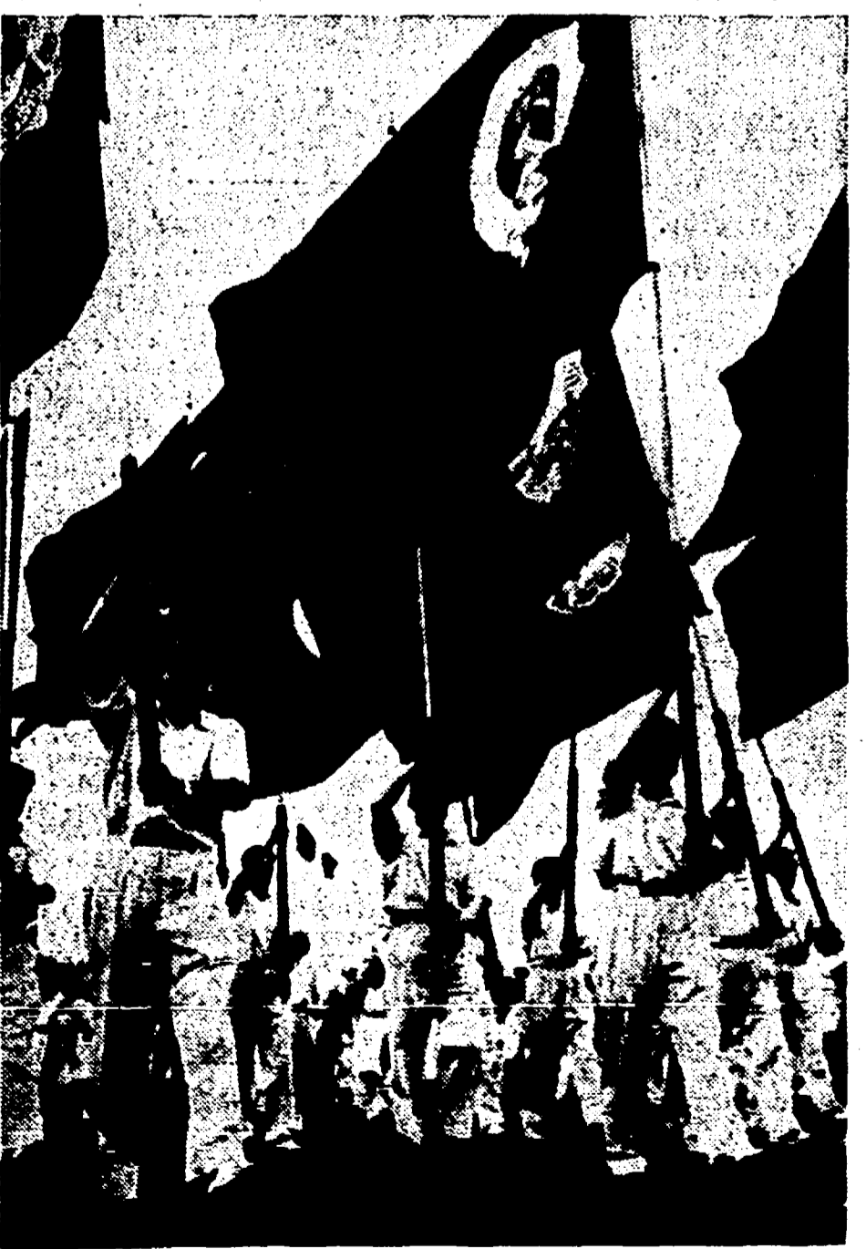
U.R.S.S. - Migliaia di competizioni sportive e culturali si stanno svolgendo in tutto il territorio dell'Unione Sovietica in preparazione del Festival al quale i giovani parteciperanno con centinaia di manifestazioni.

Ma che fanno per la pace i giovani in Italia? Al Festival di Berlino, si sono preparati e si stanno preparando, si, con iniziative che dovranno mostrare le capacità artistiche e