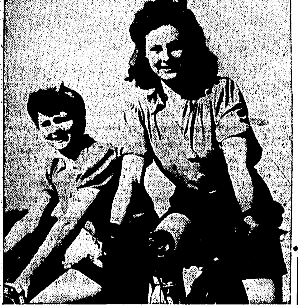
La ragazza d'Italia hanno vent'anni: sorridono alla vita e a un avvenire di lavoro e di pace

Non crediamo vi sia bisogno di illustrare particolarmente le bellezze della località prescel-