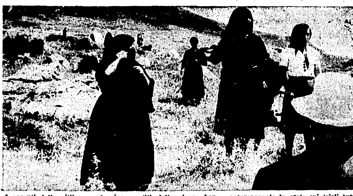
I parenti delle vittime e alcuni superstiti della strage hanno accompagnato la corte sui tristi luoghi dell'orrendo eccidio