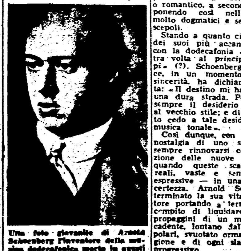
Una foto giovanile di Arnold Schoenberg inventore della musica dodecafonica scattata in questi giorni in America

«Uno spettacolo di danza alla Villa d'Este di Tivoli» L'orchestra sarà diretta dal maestro Willy Ferrero