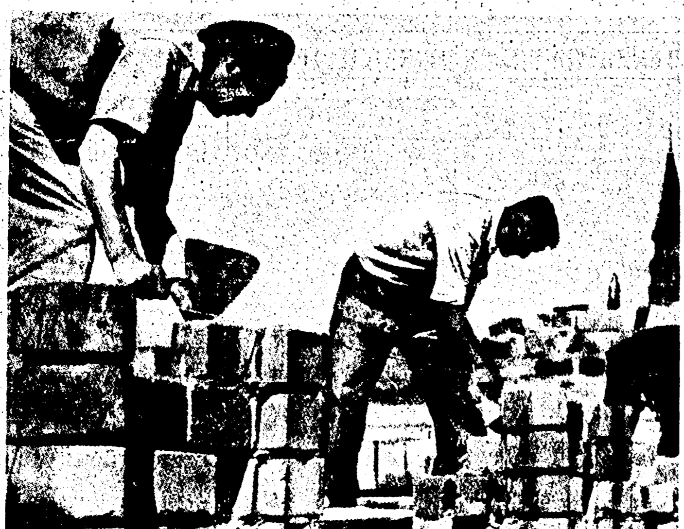
POLONIA - Domani ricorre il settimo anniversario della liberazione polacca. Il popolo in festa celebra le vittorie ottenute dalla Repubblica nel campo della ricostruzione e della pace