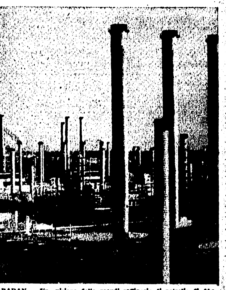
ABADAN - Una visione delle grandi raffinerie di petrolio di Abadan. La città da molti giorni sotto la minaccia di numerose aavi da guerra degli imperialisti teologi.