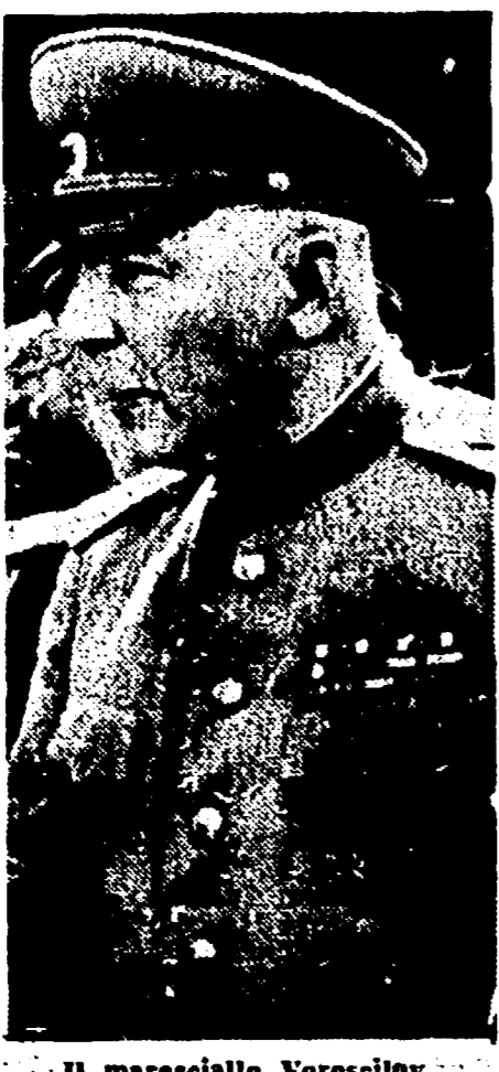
Il maresciallo Vorosilov