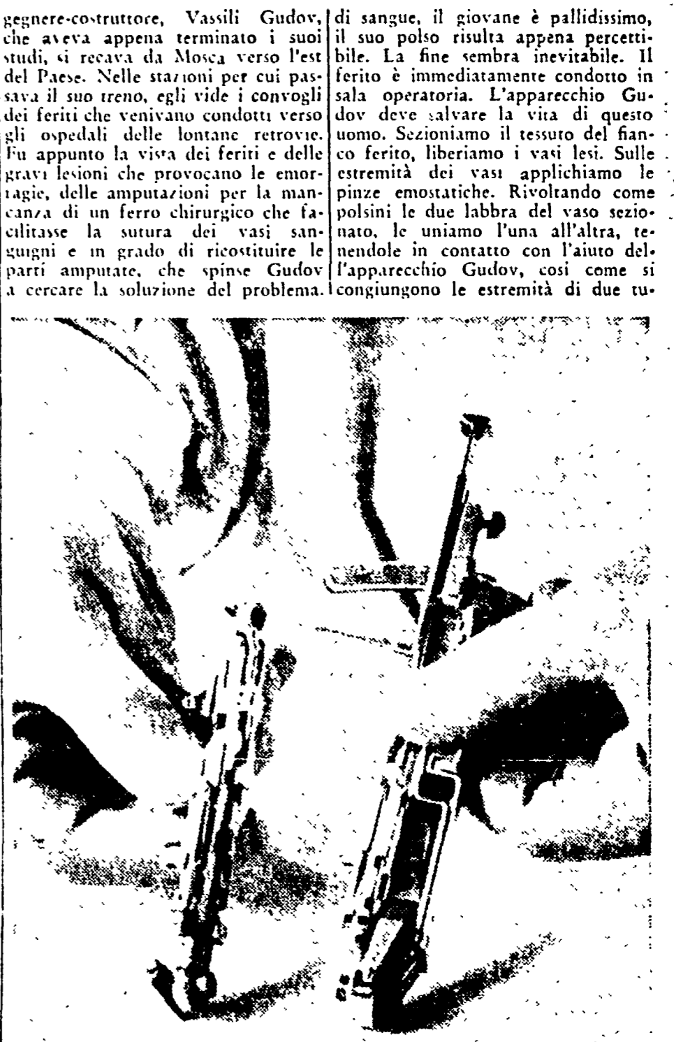
L'apparecchio di Gudov è pronto per l'operazione. La sutura di una arteria con tale strumento richiede solo poche frazioni di secondo

La morte per emorragia è una cosa troppo orribile, troppo dolorosa... Il problema della sutura vascolare richiamava su di sé da molto tempo l'attenzione dei maggiori chirurghi sovietici... L'ingegnere costruttore, Vassili Gudov, di sangue, il giovane è pallidissimo, il suo polso risulta appena percettibile. La fine sembra inevitabile. Il ferito è immediatamente condotto in sala operatoria. L'apparecchio Gudov deve salvare la vita di questo uomo. Sezioniamo il tessuto del fianco ferito, liberiamo i vasi lesi. Sulle estremità dei vasi applichiamo le pinze emostatiche. Rivoltando come polsini le due labbra del vaso sezionato, le uniamo l'una all'altra, tenendole in contatto con l'aiuto dell'apparecchio Gudov, così come si congiungono le estremità di due tu-