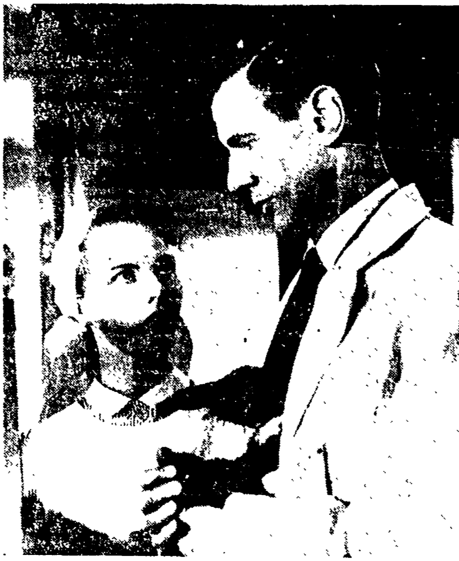
Una scena di «Corse bianche», modesta opera cinematografica dell'inglese Pat Jackson, che rivela con serietà di intenti, ma senza il necessario approfondimento, alcuni aspetti della vita negli ospedali...