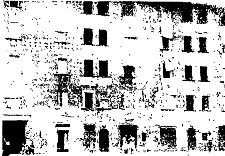
LIVORNO - Dalle finestre pavese di bianco, il colore della pace, la popolazione protesta contro l'istituzione del Logistical Command.

Non è certo con due interrogati lasciati in sospeso che si può liquidare l'argomento - avvenire del porto di Livorno; altrettanto semplicemente non è possibile liquidare l'altro importante argomento - avvenire della zona industriale. Qui si fa un gran parlare della legge elettorale della legge Toyni e la sorte dello stabilimento metallurgico e della Molifides sono due esempi palpabili e tutt'altro che scollati dalle vicine di casa e della serietà.