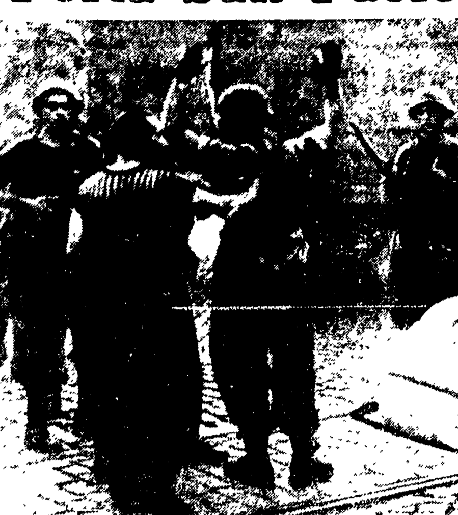
Domani alle 18,30 a piazza Porta S. Paolo il gen. Iussu rievocherà la data dell'8 settembre in un pubblico comizio al quale tutta la cittadinanza è invitata ad intervenire. Questo raro documento fotografico mostra un invasore nazista che si arrende ai soldati e ai civili italiani sotto la storica Porta.