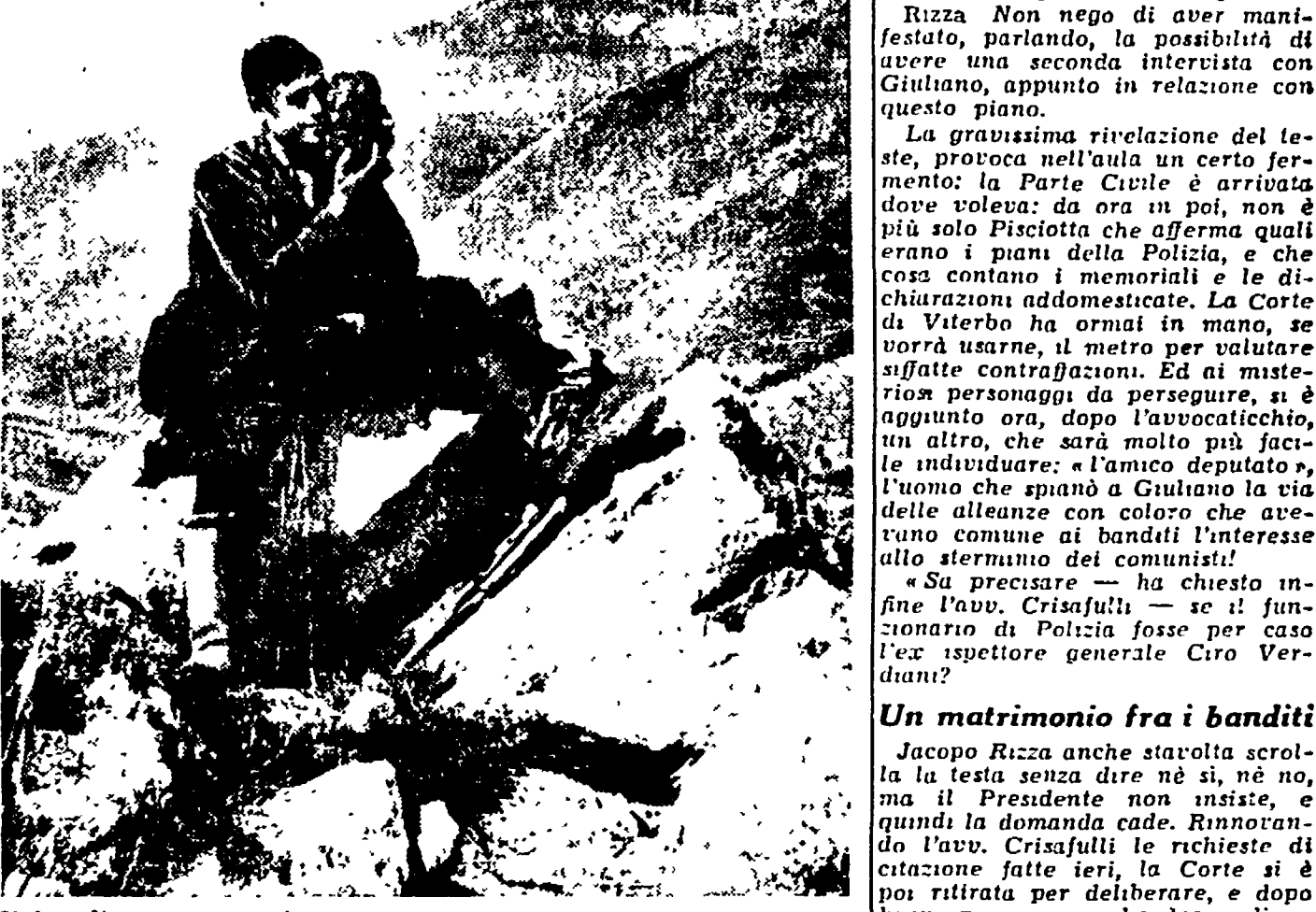
Il bandito Salvatore Giuliano aveva un debole per le fotografie ed i documenti interessanti a sua persona. Molto probabilmente, quello girato dal fotografo Ivo Medanesi, sarà proiettato di fronte alla Corte di Viterbo. Ecco una foto che mostra Giuliano mentre fra un delitto e l'altro si dilettava di cinematografia.