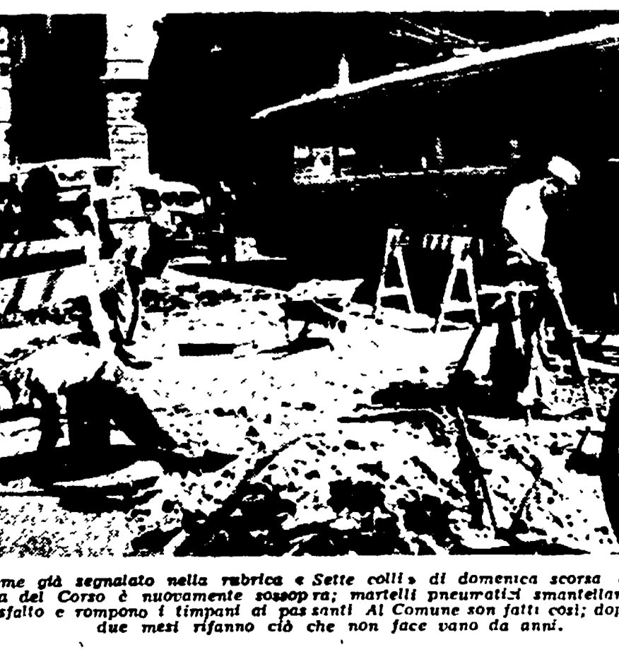
Come già segnalato nella rubrica «Sette colli» di domenica scorsa la Via del Corso è stato sottoposto a lavori di manutenzione straordinaria...