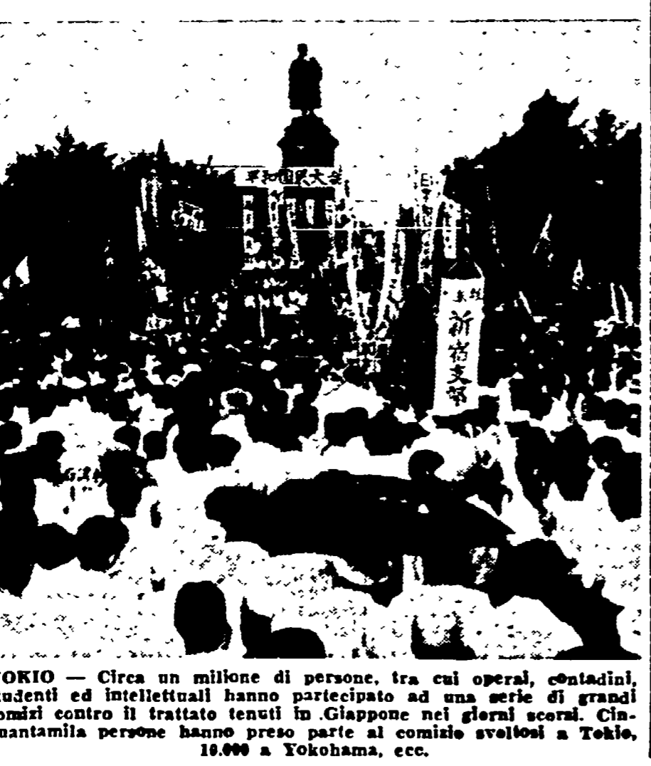
TOKIO - Circa un milione di persone, tra cui operai, contadini, studenti ed intellettuali hanno partecipato ad una serie di grandi manifestazioni contro il trattato di San Francisco... « Un milione di persone hanno preso parte al comizio svoltosi a Tokio... »