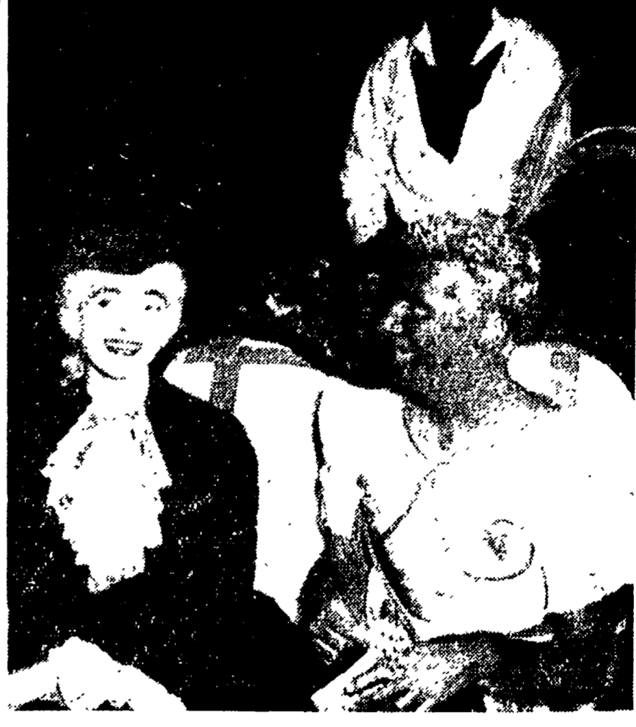
La multimiliardaria americana Barbara Hutton alla festa di Palazzo Labia. Il manto che essa veste è stato valutato al prezzo di 15.000 dollari, pari a 10 milioni di lire italiane

L'estate sta per finire. Le organizzazioni democratiche hanno assicurato felici vacanze a migliaia di bambini