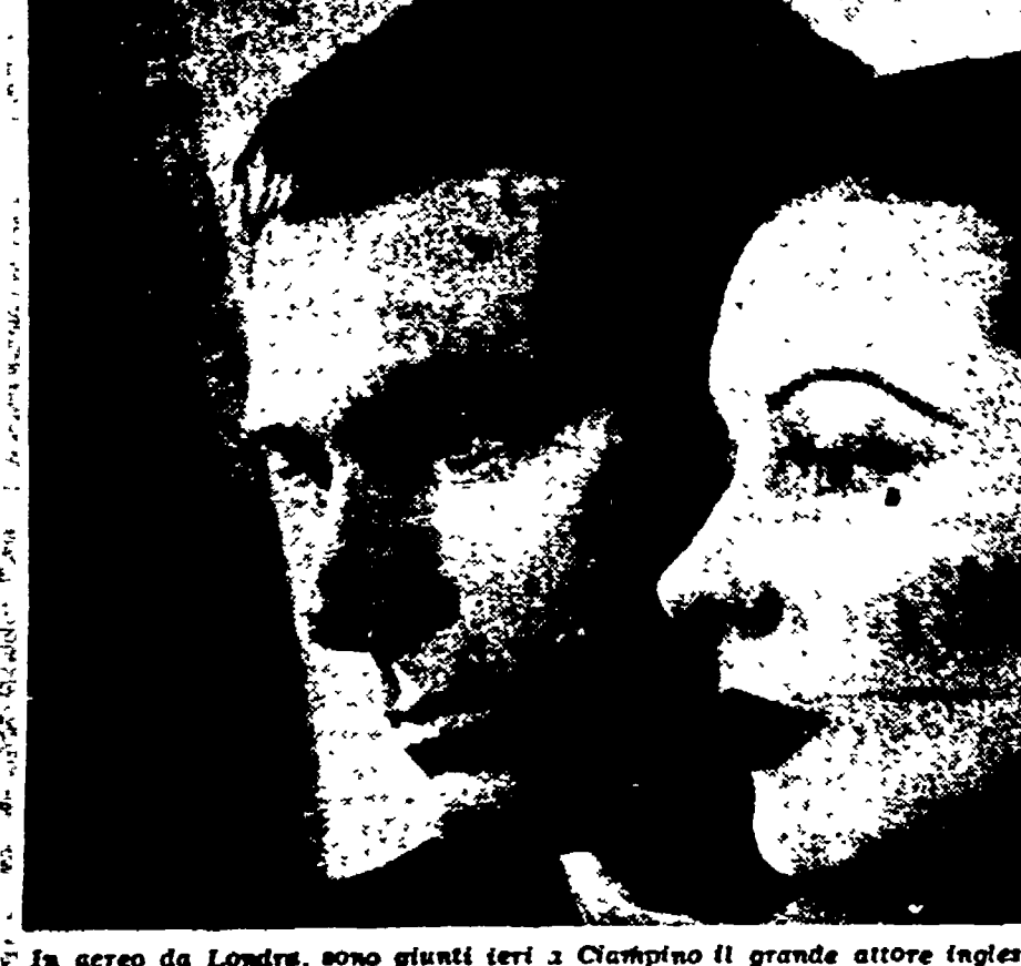
In aereo da Londra, sono giunti ieri a Ciampino il grande attore inglese Lawrence Olivier e la sua consorte Vivien.