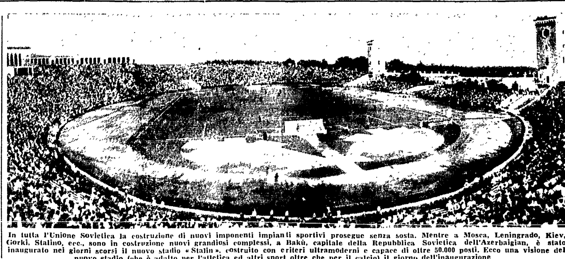
In tutta l'Unione Sovietica la costruzione di nuovi imponenti impianti sportivi prosegue senza sosta. Mentre a Mosca, Leningrado, Kiev, Gorki, Stalino, ecc., sono in costruzione nuovi grandi complessi, a Baku, capitale della Repubblica Sovietica dell'Azerbaigian, è stato inaugurato nei giorni scorsi il nuovo stadio «Stalin», costruito con criteri ultramoderni e capace di offrire 50.000 posti. Ecco una visione del nuovo stadio (che è adatto per l'atletica ed altri sport oltre che per il calcio) il giorno dell'inaugurazione

Com-Milan e Sampdoria-Napoli sono le principali attrazioni dell'edizione del campionato di Serie A. Sono di gran lunga le più interessanti, anche se Bologna-Fiorentina, Palermo-Lazio e naturalmente le partite casalinghe dell'Inter e della Juventus non mancano di arricchire il programma. Ma sono, questi, numeri secondari senza dubbio, perché il collaudo severo cui attende il Milan ed il Napoli deve fornire indicazioni precise per il proseguo della lotta per il primato, la quale - dopo le prime quattro giornate - non ha prodotto una selezione ma ha accumulato nella prima poltrona quattro capitoli, a sette punti ed «a punto» secondo media.