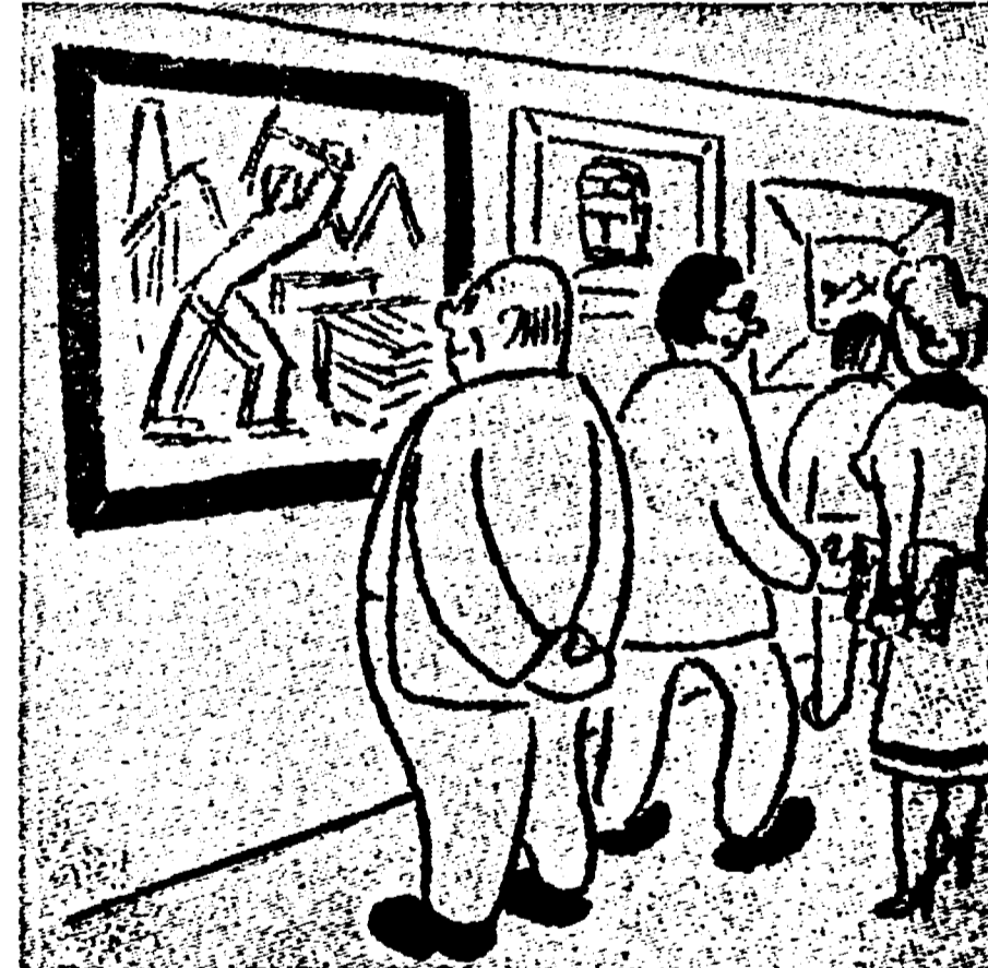
Stand, stand, stand: le democratiche popolari in vetrina. «Questi si che vanno forte!», commentano i visitatori entusiasti