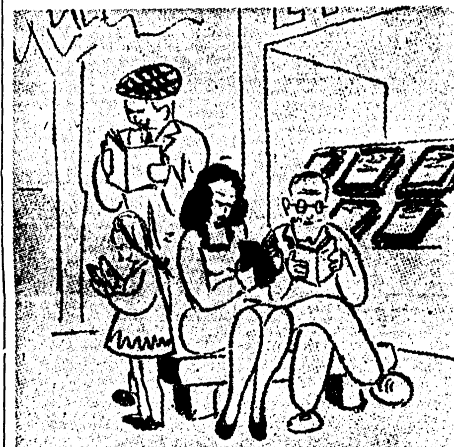
Questo è lo stand del libro popolare. Si legge, si pensa, si apprezza la buona lettura. Non confondetevi, però! La mostra è bella e gli argomenti sono tanti, ma non dimenticatevi di uscire almeno con un libro sotto il braccio

I versamenti per la sottoscrizione e le cifre della diffusione straordinaria de «L'Unità» saranno annunciati volta per volta dagli atopartanti della Fiera.