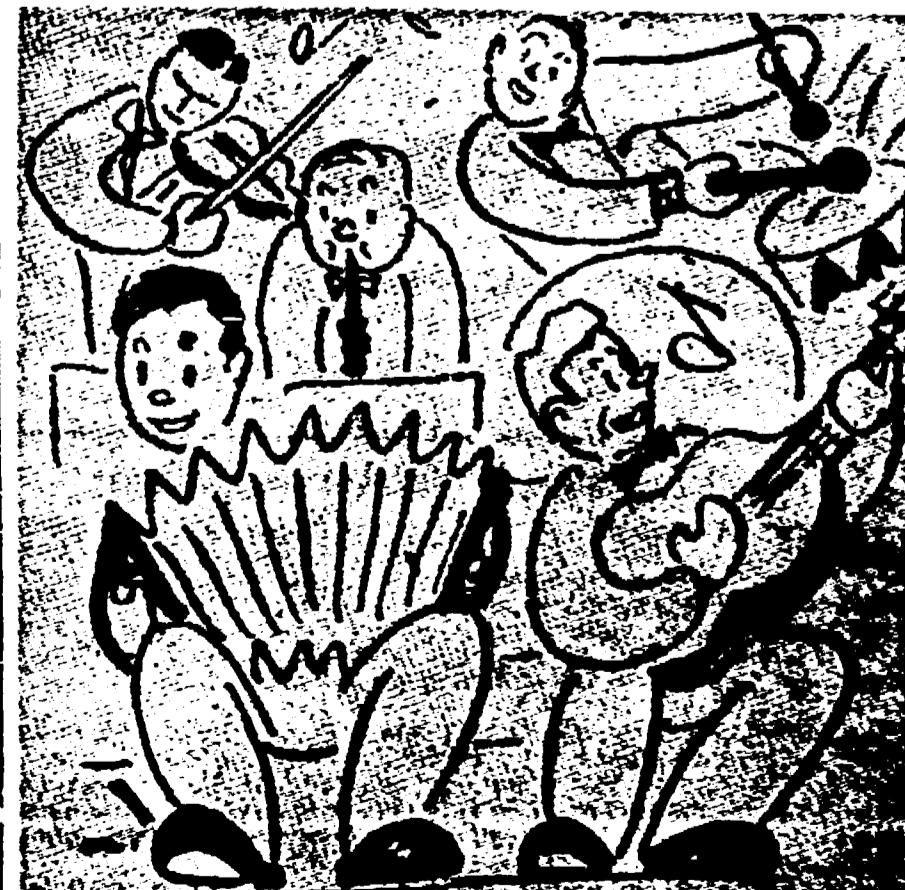
Ora un po' di riposo. Come? Un po' di riposo? Sembrano stonati! Nella gioventù, ma tu visitatore di mezza età non allarmarti. Chiedi semplicemente al musicista: «Facevo un tempo»