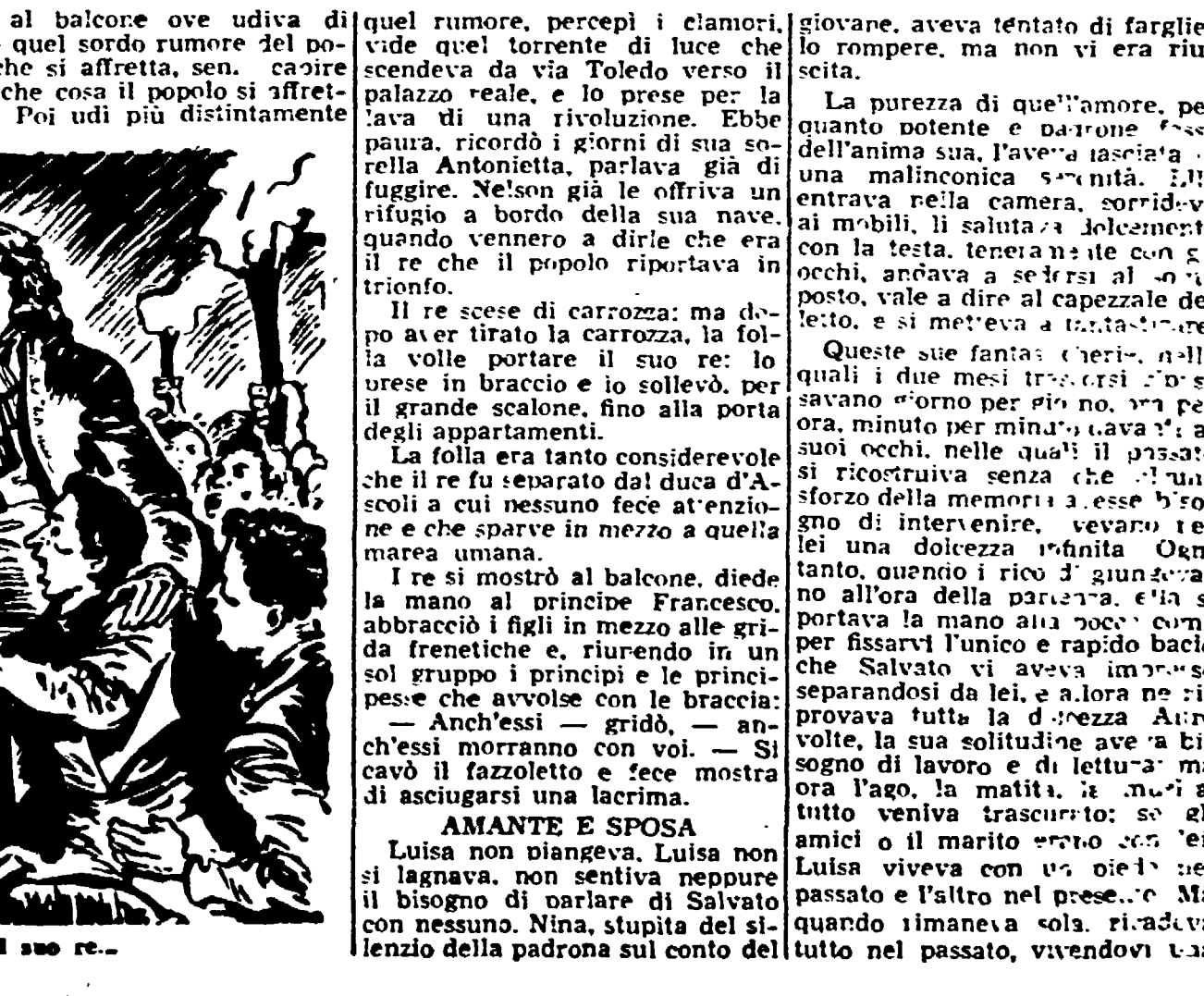
La follia volle portare il suo re...