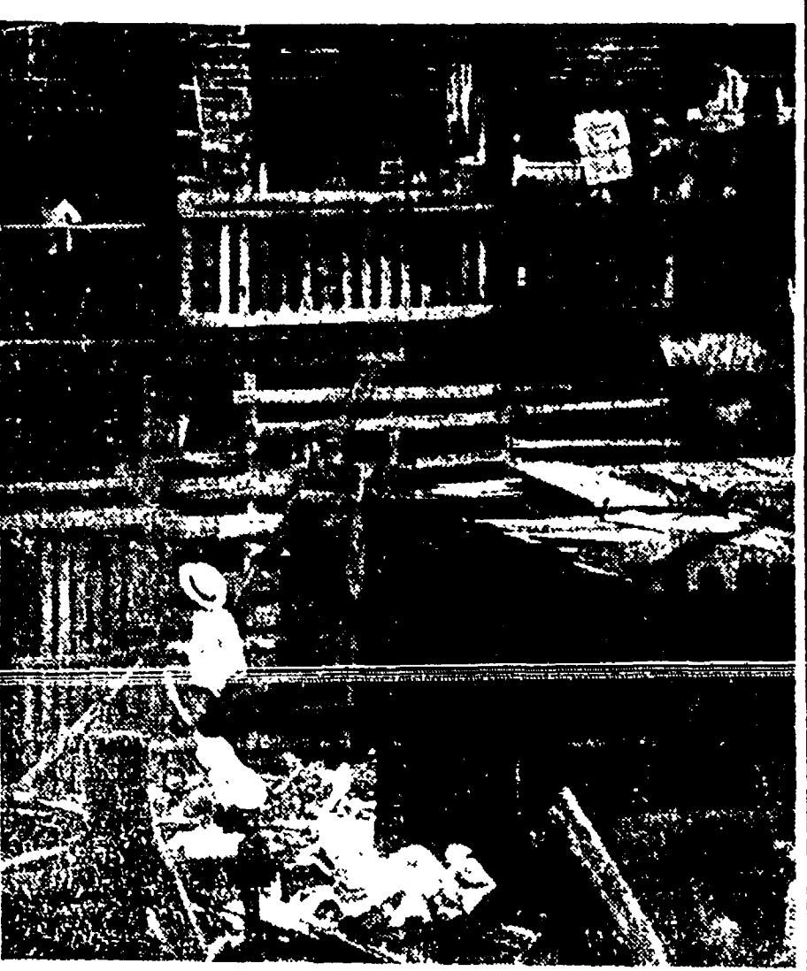
Alloggi di questo genere si trovano nel cuore di Chicago, una delle maggiori città americane. E la miseria dei quartieri popolari di New York, di Boston e di Washington presenta lo stesso volto

L'inasprimento della lotta di classe negli Stati Uniti è dimostrato dalla rapida radicalizzazione delle masse organizzate che si va manifestando nell'interno