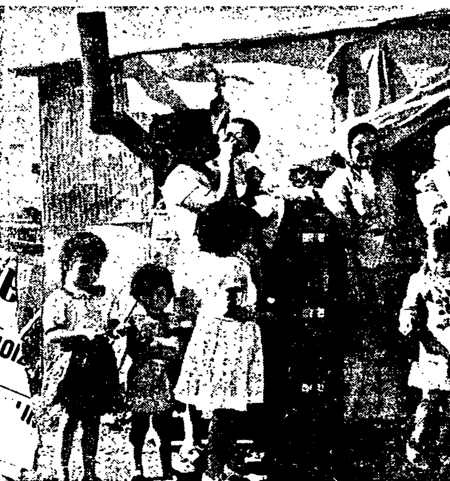
Undici persone vivono in una simile baracca, a Sant'Antonio, nel Texas. Dopo l'inizio dell'aggressione in Corea, Truman ha dimezzato la già esigua somma destinata annualmente alla costruzione di case

Il peggioramento dei condizioni di lavoro. Nella caccia ai superprofitti i fabbricanti americani si guardano bene dall'impiegare mezzi per la tecnica antinfornistica. Lo dimostrano i dati sull'aumento degli infortuni sul lavoro.