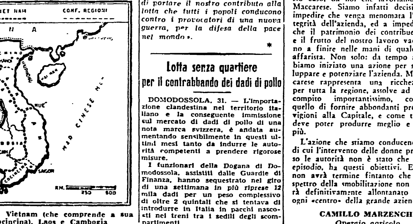
L'Indocina nelle sue diverse parti: Vietnam (che comprende a sua volta Tonchino, Annam e Cochinchina), Laos e Cambogia

Un tempo ci pensavano i redattori «singolati» (o rotti, alla giornata) di un giornale francese, a ricordare periodicamente agli statalisti l'esistenza di Paesi lontani come la Malesia, la Cambogia, il Laos, e scrivevano articoli «pittorreschi», narravano dei lontani popoli «selvaggi», parlavano dei benefici che ad essi recava la civiltà occidentale, imperniata dalle grandi compagnie coloniali inglesi e francesi.