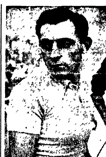
Il ruolo Ling (Inghilterra) arbitrerà Italia - Svezia

DUBLINO. - A Monaghan ha avuto luogo oggi la prima delle riunioni in provincia organizzate con la partecipazione di pugili della rappresentativa italiana dei dilettanti. I quattro dilettanti italiani impegnati in questa sera hanno superato senza difficoltà i loro avversari irlandesi.