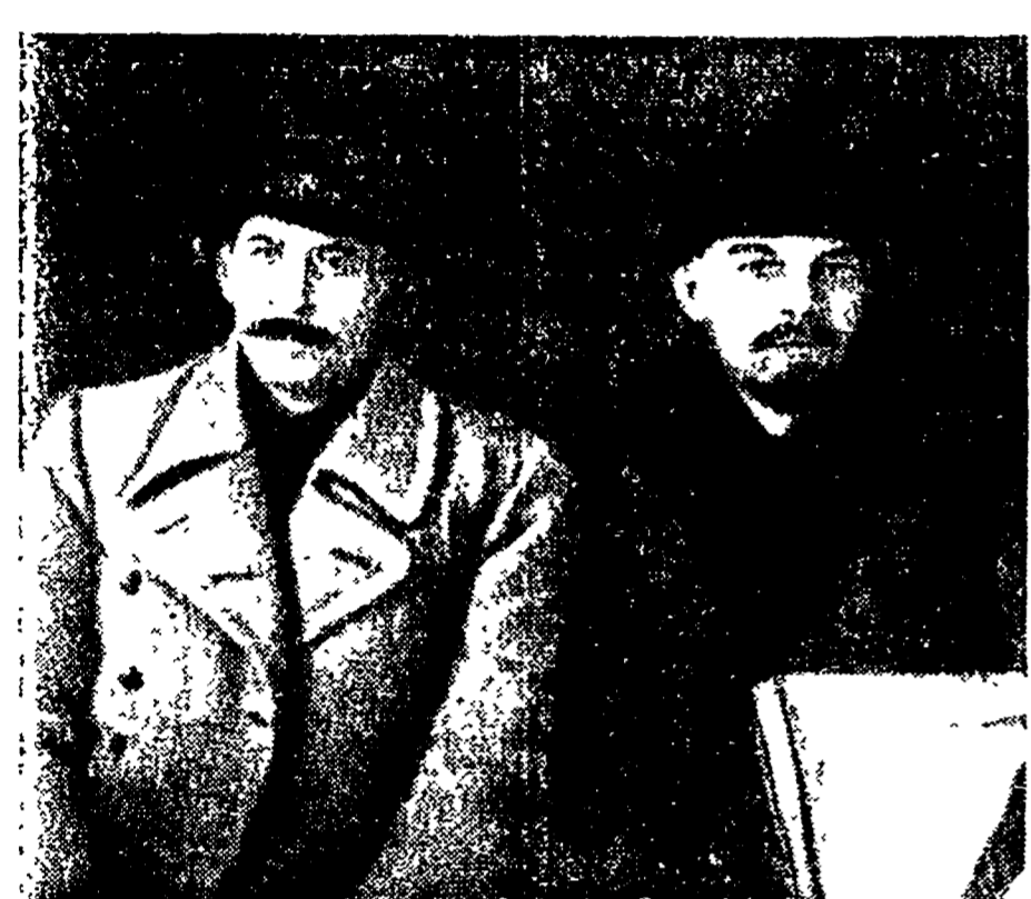
Lenin e Stalin nel 1919