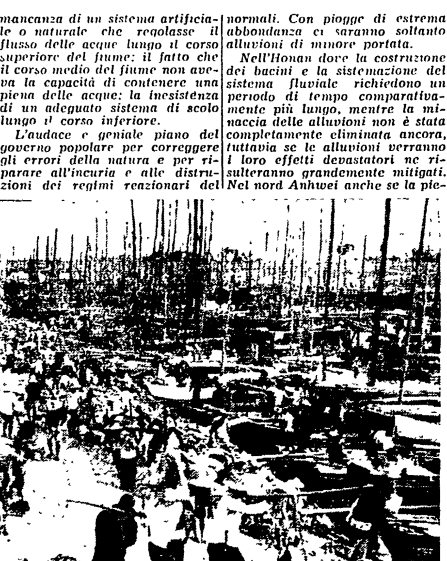
CINA - Una visione degli immensi lavori sul fiume Huai. Tre milioni di contadini sono riusciti a domare le acque e a recare vita, prosperità e sicurezza in una enorme zona del Paese continuamente minacciata dalle alluvioni in questo modo, i raccolti in un settore del territorio cinese sono salvi

L'infido fiume Huai, che passa attraverso le tre province dello Honan, dello Anhwei e dello Kiangsu viene giorno per giorno inondando un esercito di tre milioni di contadini del fiume, contadini liberati dalla valle dello Huai... La triplice battaglia - fra l'uomo e la natura; fra la più moderna concezione del controllo delle acque, provenienti dall'esperienza sovietica, e le idee conservatrici degli ingegneri di vecchio stampo; e la battaglia contro il tempo per realizzare il progetto prima che cominciasse la stagione delle alluvioni - è stata vinta. La lotta per portare la vita, la prosperità e la sicurezza a circa 29 milioni di contadini delle acque, provenienti dall'esperienza sovietica, e le idee conservatrici degli ingegneri di vecchio stampo; e la battaglia contro il tempo per realizzare il progetto prima che cominciasse la stagione delle alluvioni - è stata vinta. La lotta per portare la vita, la prosperità e la sicurezza a circa 29 milioni di contadini delle acque, provenienti dall'esperienza sovietica, e le idee conservatrici degli ingegneri di vecchio stampo; e la battaglia contro il tempo per realizzare il progetto prima che cominciasse la stagione delle alluvioni - è stata vinta.