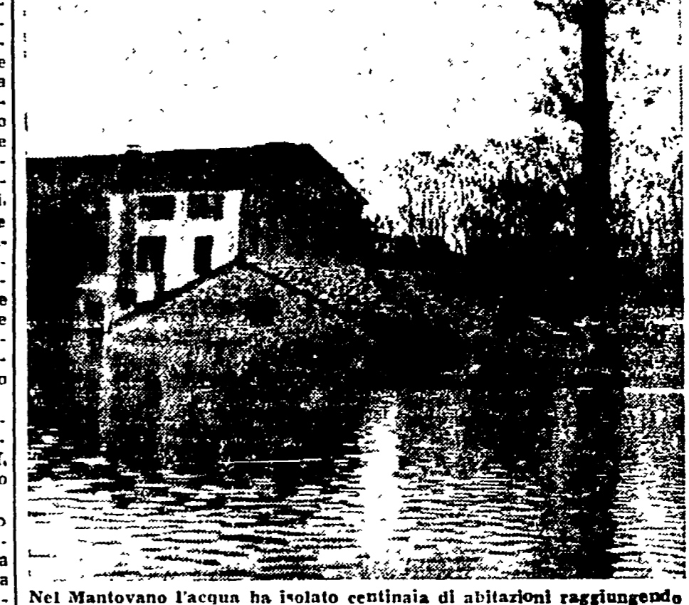
Nel Mantovano l'acqua ha isolato centinaia di abitazioni raggiungendo i tetti delle case e dei cascinali