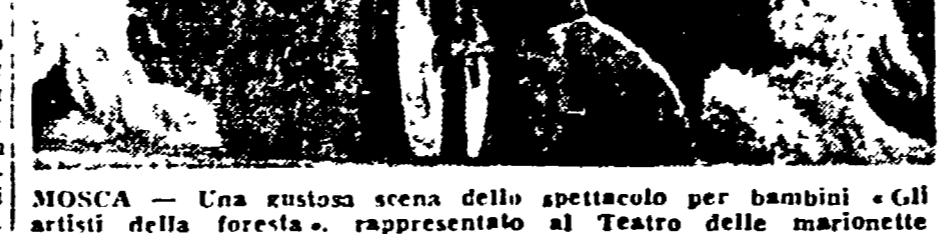
MOSCA - Una gustosa scena dello spettacolo per bambini «Gli arcieri della foresta», rappresentato al Teatro delle marionette...