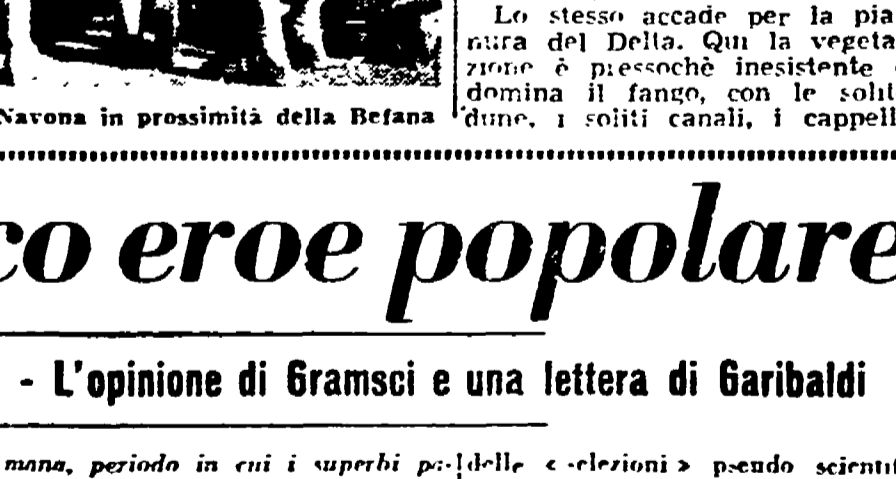
ROMA - Piccoli compratori a F. Navona in prossimità della Befana