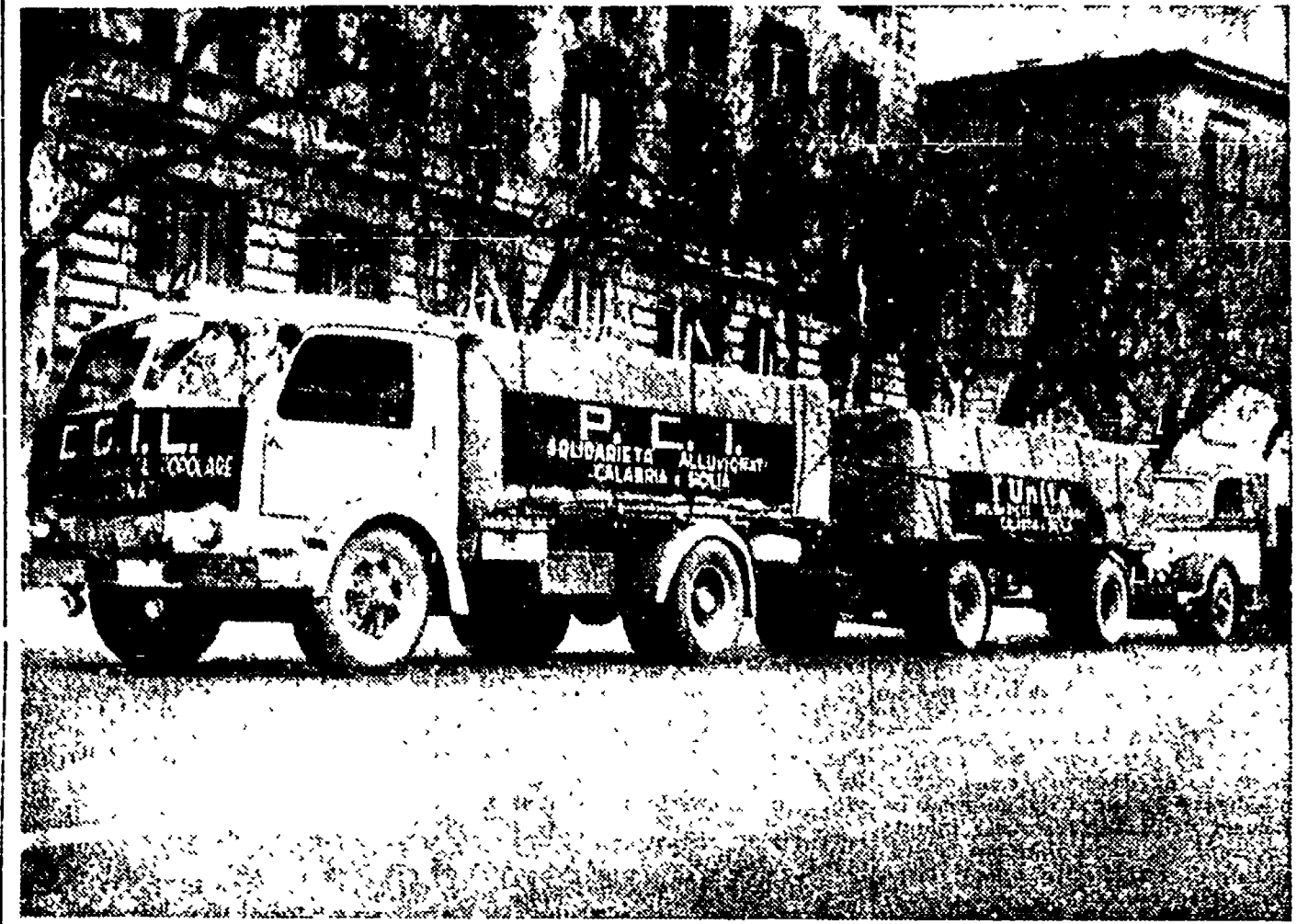
L'autocolonna del Comitato di solidarietà che reca i soccorsi alle popolazioni alluvionate del Mezzogiorno dinanzi alla sede della CGIL in Roma poco prima della partenza.