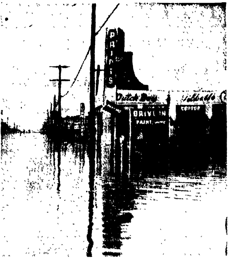
STATI UNITI - Le forti piogge dei giorni scorsi hanno provocato inondazioni in California. Ecco il centro di Downey allagato