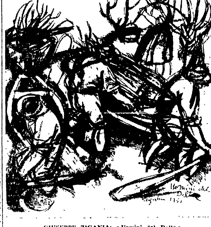
GIUSEPPE ZIGAINA: «Uomini del Delta»