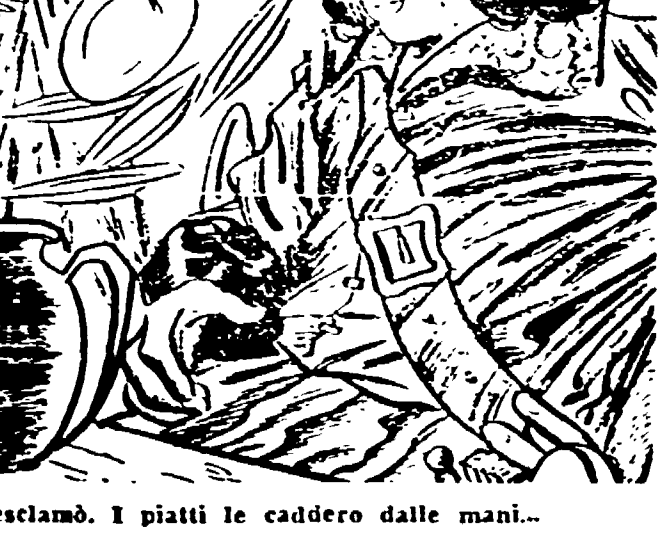
«Lui!» esclamò. I piatti li caddero dalle mani...

degno marito, non vi vedeva mai arrivare senza terrore! Il cavaliere la guardò come per chiedere di lui. - Dio abba l'anima sua, pover'uomo! E' morto sette anni fa. E con quella speciale ipocrisia che si perdona alle grazie giovani, Ughetta approfittò di quel ricordo per dare un libero corso alle sue lacrime che già le bagnavano le pupille. Ma sarebbe stato impossibile precisare se era proprio la morte di suo marito che la faceva piangere, o la gioia del ritorno del cavaliere di Pardaillan. - E di che diavolo è potuto morire? - domandò il cavaliere - Aveva una salute così fiorente. - Proprio! - disse Ughetta asciugandosi gli occhi - E' morto per la troppa salute. - Sì, era troppo grasso. Glielo dicevo sempre. - Parlavamo, come si dice, tante parole per parlare. Ughetta esclamò di sfuggita il cavaliere, constatando, forse con segreta soddisfazione, che egli non aveva dovuto fare fortuna: da certi dettagli percettibili solo allo sguardo della donna che ama (quel guardando, mentre indicava i rotami sparsi sul pavimento) di Ughetta si mise a ridere. - E' vero, infatti - disse - Voi e il signor vostro padre avete causato sempre grandi danni. Per questo Gregoire, per mio