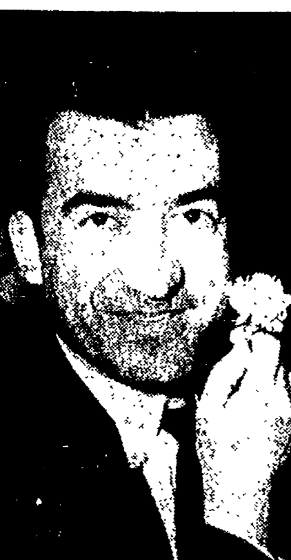
Nell'aula del tribunale l'eroe greco Beloyannis sorride in attesa ai carcerati che lo hanno condannato a morte

Ma l'esperienza del fascismo ha insegnato agli italiani dove conducono i processi a catena contro le forze democratiche. Per questo, oggi come nel passato, il Comitato per la libertà della Grecia, che versa nel pieno spirito di solidarietà di tutti i democratici italiani, interviene in difesa dei condannati di Atene. Dopo il messaggio che 201 parlamentari italiani e cittadini di Roma, con la presidenza di Umberto Terracini, vice presidente del consiglio greco Venzelas per esortare il suo governo a compiere quell'atto di giustizia che il mondo intero attende, il Comitato per la libertà della Grecia, che versa nel pieno spirito di solidarietà di tutti i democratici italiani, interviene in difesa dei condannati di Atene. Dopo il messaggio che 201 parlamentari italiani e cittadini di Roma, con la presidenza di Umberto Terracini, vice presidente del consiglio greco Venzelas per esortare il suo governo a compiere quell'atto di giustizia che il mondo intero attende, il Comitato per la libertà della Grecia, che versa nel pieno spirito di solidarietà di tutti i democratici italiani, interviene in difesa dei condannati di Atene.