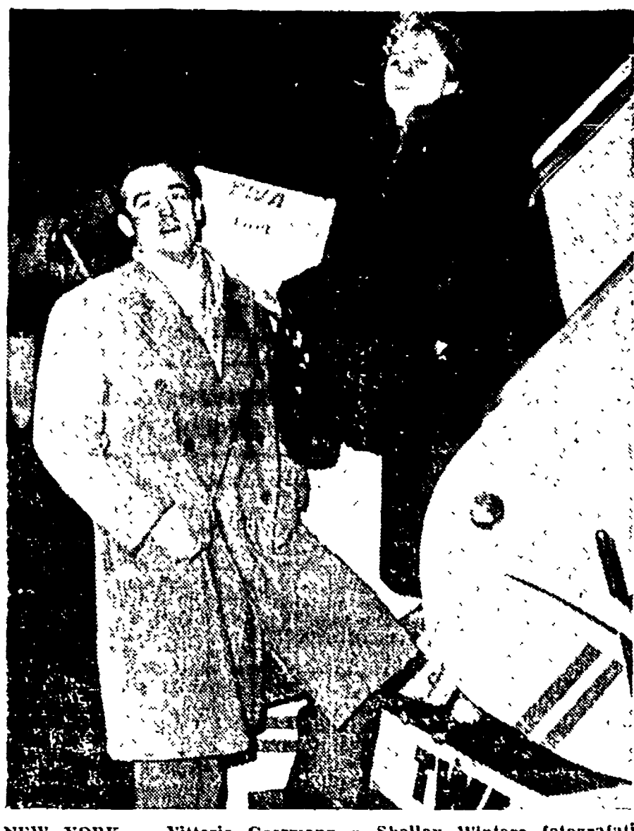
NEW YORK - Vittorio Gassman e Shelley Winters fotografati all'aeroporto «La Guardia» mentre sono in procinto di partire alla volta di Los Angeles. Sembra che i due attori si sposeranno presto...