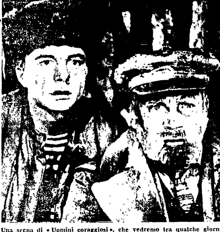
Una scena di «Uomini coraggiosi», che vedremo tra qualche giorno