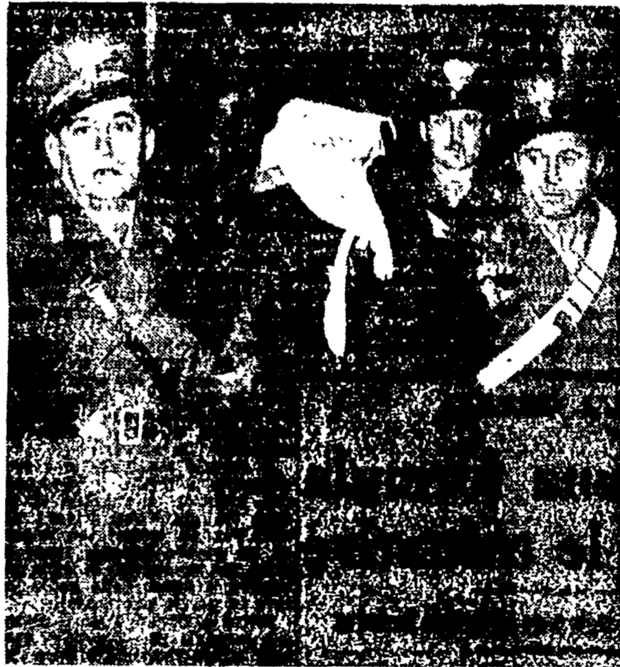
La Fort si copre mentre i fotografi la assalgono all'ingresso in aula