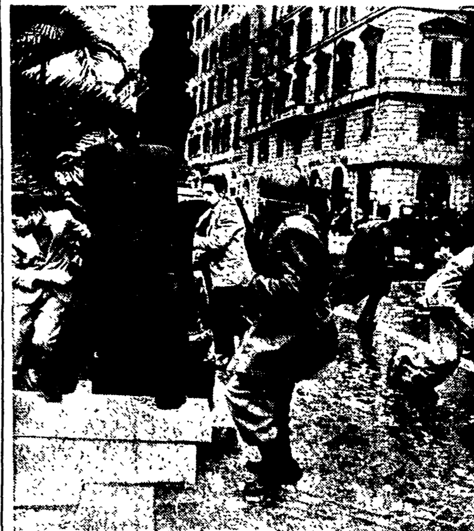
Anche ieri a Roma a Milano, Napoli Palermo e in altre decine di città italiane centinaia di studenti hanno dimostrato nelle strade per l'abbandonamento delle truppe straniere da Trieste. A Roma la polizia è intervenuta con particolare violenza contro gli studenti che hanno protestato sotto le finestre dell'Ambasciata americana e al Viminale. La foto mostra un particolare degli scontri davanti all'Opera

Giacimenti di petrolio nei pressi di Lucera