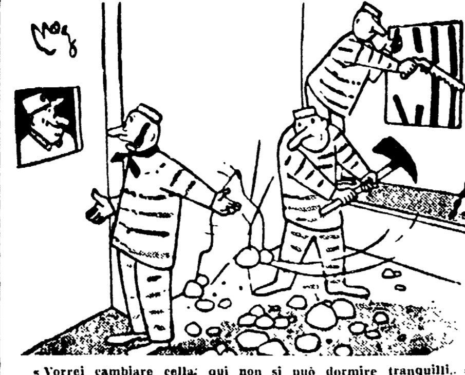
«Vorrei cambiare cella: qui non si può dormire tranquillo...»