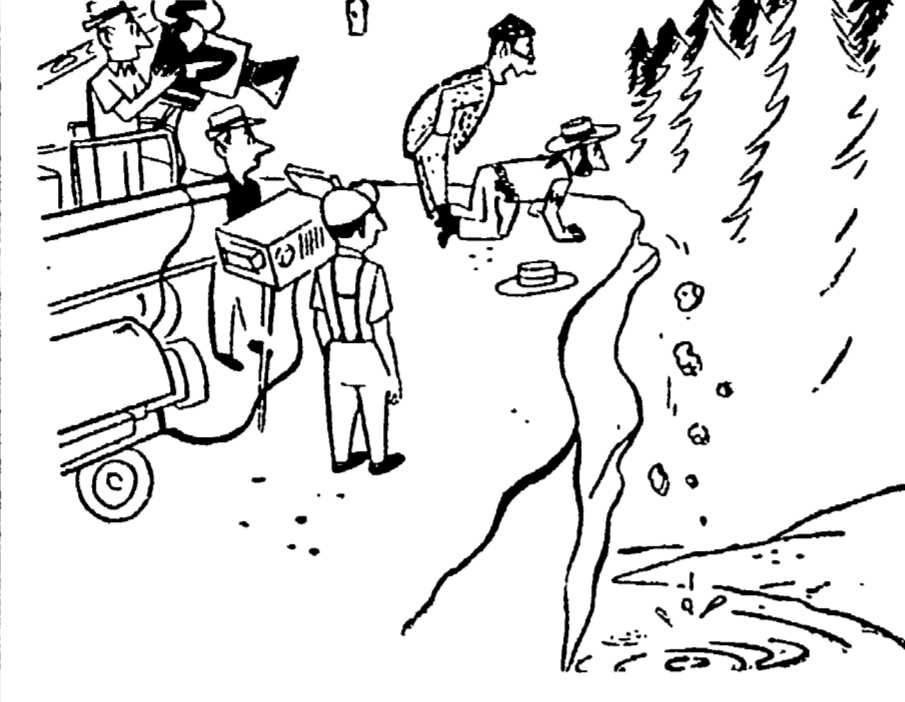
«Beh, dopo tutto il lieto fine non era adatto a questo film...»