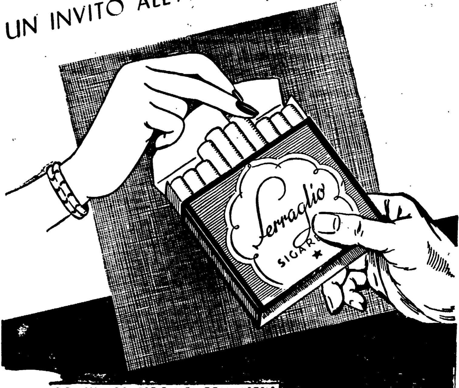
SIGARETTA CONFEZIONATA CON MISCELE DI TABACCHI SCELTI ED AROMATICI