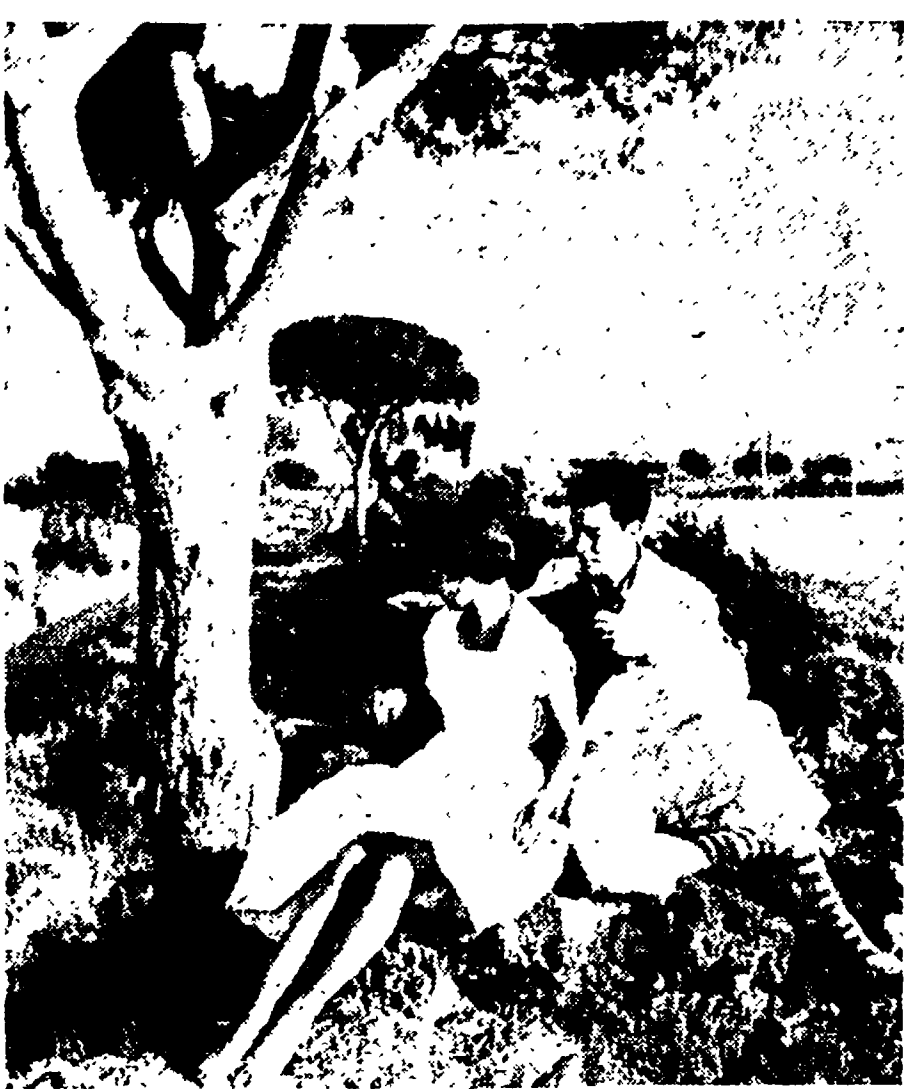
Decine di migliaia di romani, fra oggi e domani, abbandonano la città...