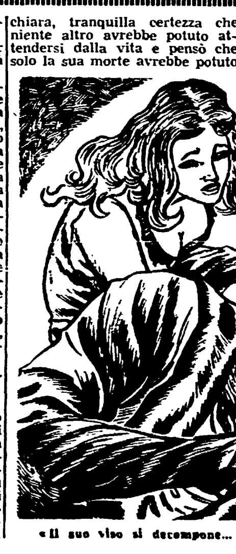
«Il suo viso si decomponne... Sì, però, mio padre muore...»

Mentre Mastro Claudio spezzava, nel più desiderato attimo di felicità, la sua terribile esistenza, Belgodere, pazzo di dolore e di odio, si gettò sulle tracce di sua figlia Stella.