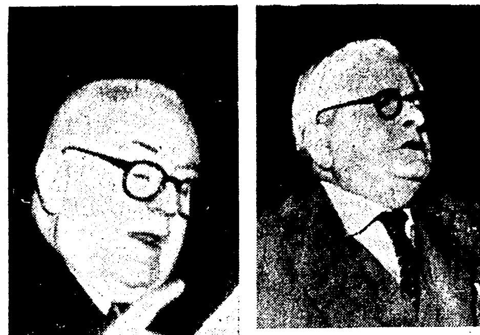
Il sen. Arturo Labriola