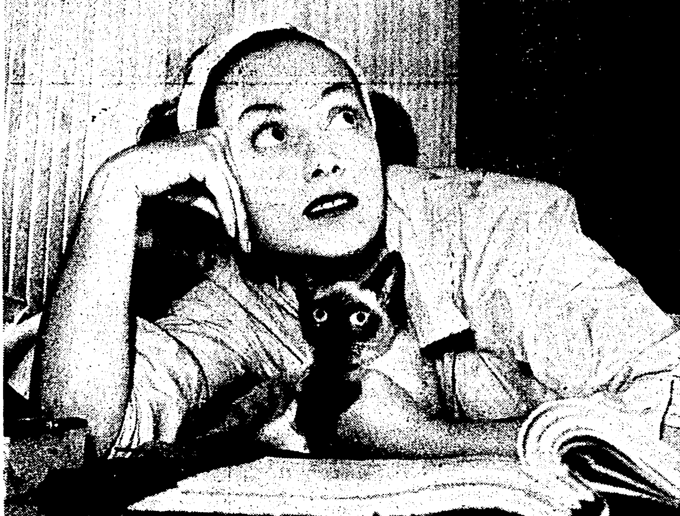
Marisa Merlini la simpatica e intelligente attrice italiana della rivista colta dall'obiettività nell'intimità domestica insieme al suo amico preferito: un verosimile gattino sinese che non pare eccessivamente turbato dalla vicinanza della sua affascinante padroncina. Marisa insieme col suo gattino fotografato il copione della prossima rivista con cui farà il giro dei maggiori teatri della Penisola