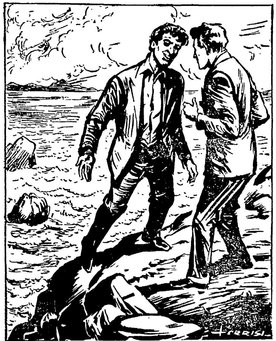
Tancredi si mise tra me e il mare...

Basta metterne un po' in un bicchierino. E' molto facile, non occorre coraggio". Mia moglie è rimasta esterrefatta. Non so come finirà, non lo so proprio. Non vedo alcun modo di evadere da Tancredi. E' nei miei pensieri giorno e notte, non riesco a concedermi un minuto di sonno tranquillo. E, sotto le sue sfilate continue, sento che la mia resistenza incomincia a cedere. L'orribile fatto è che io desidero ucciderlo, non soltanto perché lo odio, ma per dimostrargli una volta per sempre che non sono il vigliacco che egli mi giudica. Beh, mio caro avvocato Westmore, questa è la storia. Se avrete mai occasione di leggere questa lettera, comportatevi come meglio crederete. Vorrei sinceramente, Michele Rockinshaw. « E qual'è stata la conclusione? — domandò, mentre Westmore riponeva la lettera. — Michele assasinò Tancredi? ». « Come vi dicevo — rispose l'avvocato — non lo so in sé. Alcuni giorni dopo aver ricevuto la busta sigillata, i cadaveri dei due uomini furono rinvenuti tra gli scogli sotto Cliff Walk ».