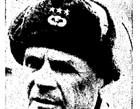
Il criminale Ridgway succederà ad Eisenhower?