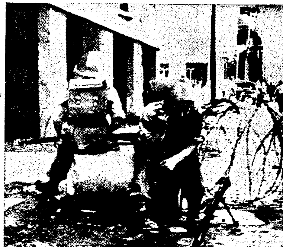
SAIGON. Reparti dell'esercito colonialista francese presidiano una cittadina vietnamita nella zona del delta del Fiume Rosso