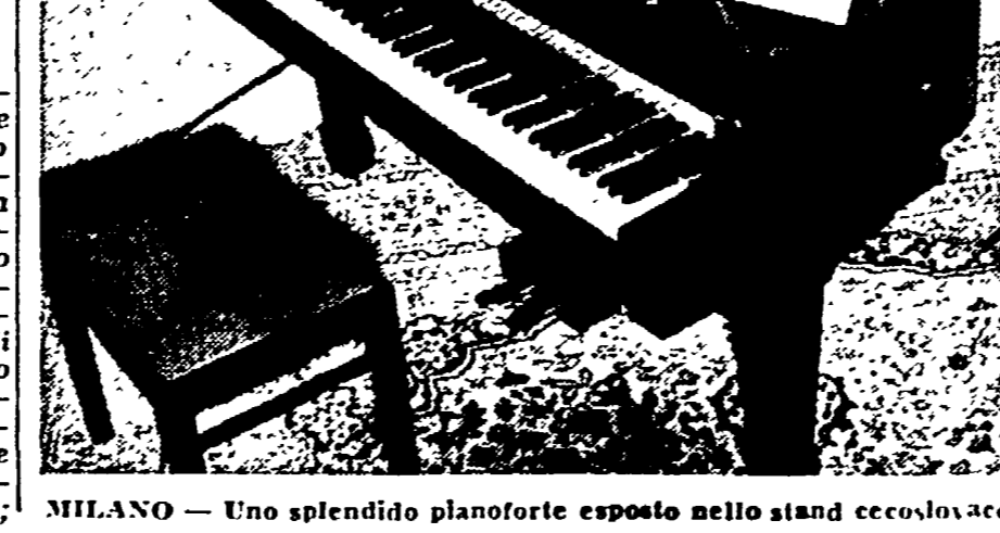
MILANO - Uno splendido pianoforte esposto nello stand cecoslovacco.

Settore per settore. Dopo il carbone, tutto il resto. La mostra nazionale di Milano, spongo settore per settore.