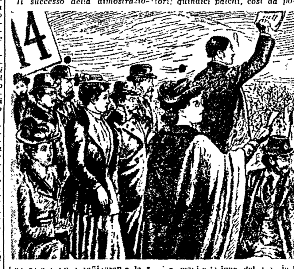
Una ragazza a parlare alla festa del Primo Maggio a Londra. Sul palco di Engels e la figlia di Marx, Eleanor, contrassegnate con un cartello nero.

bilizzazione di quelle masse operaie non specializzate, che l'aristocrazia operaia, gelosamente a guardia dei propri privilegi, cercava di mantenere fuori dalle Trade Unions e prive di qualsiasi difesa contro lo sfruttamento padronale.