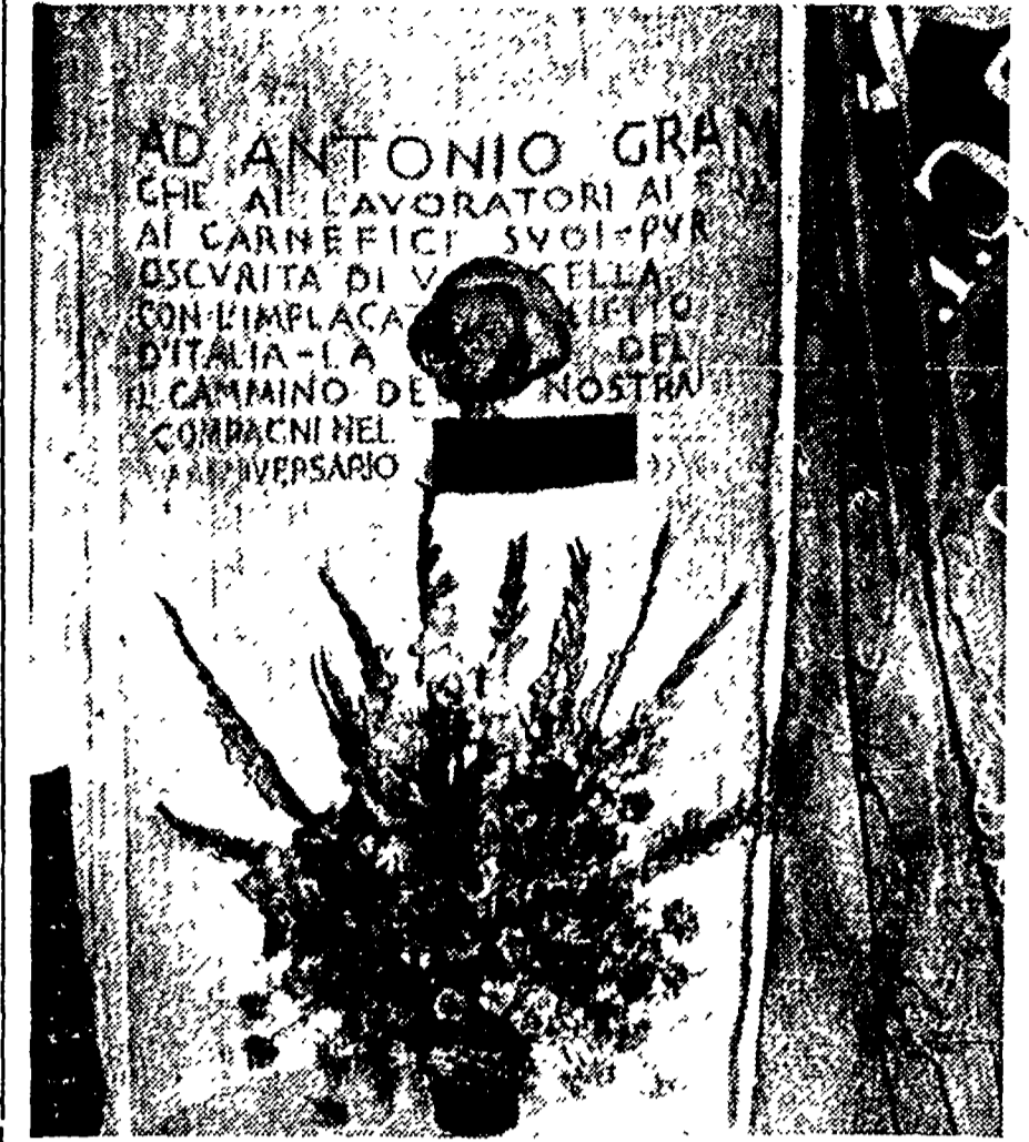
Teri, nella sede della Direzione del PCI, in Via delle Botteghe Oscure ha avuto luogo una solenne commemorazione di Antonio Gramsci. Nel corso della manifestazione hanno parlato il compagno Scelbino e Stefano Lama, vice-segretario della CGIL. Un busto di Gramsci è stato successivamente scoperto nell'atrio del palazzo