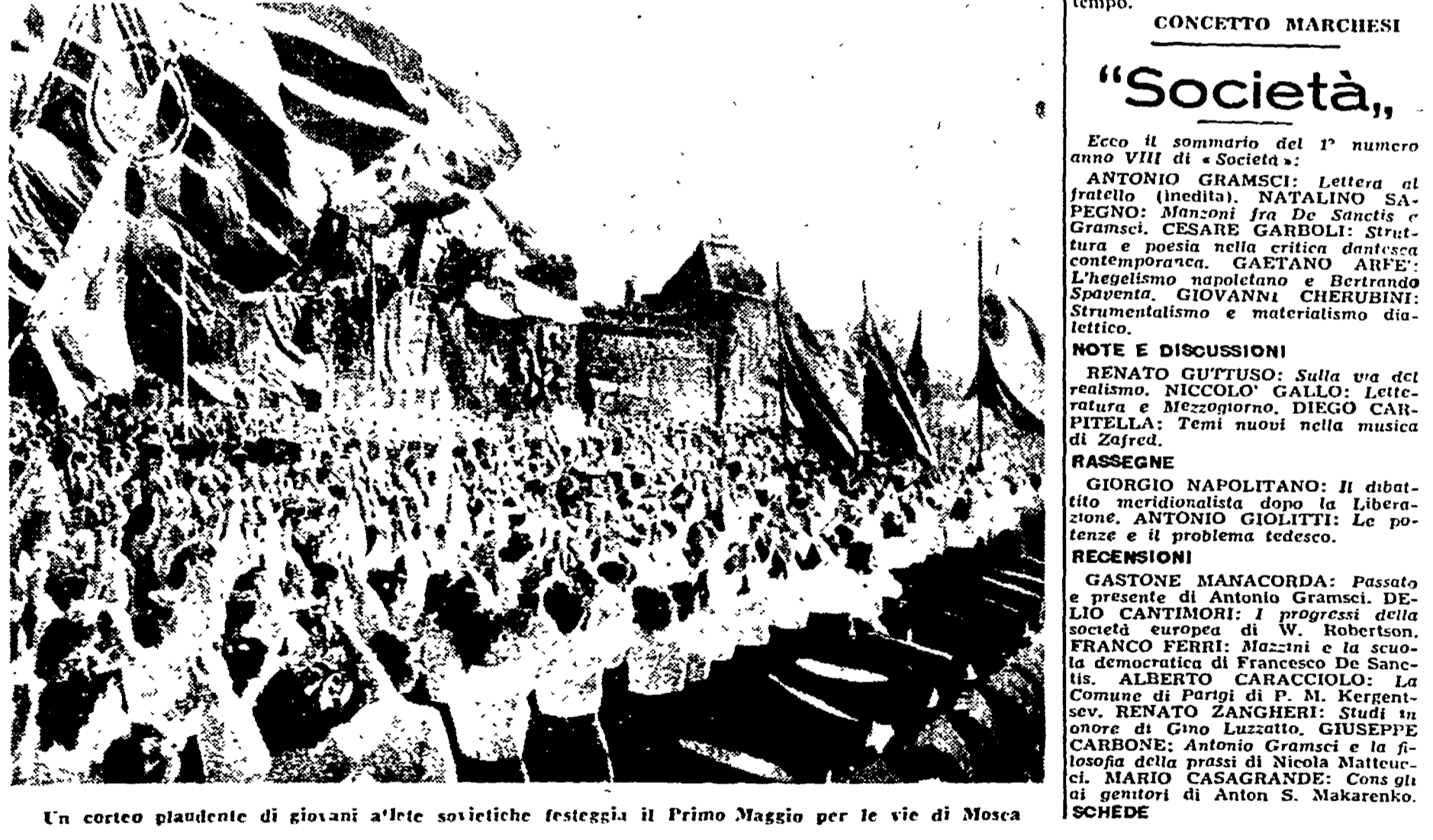
Un corteo piandente di giovani a'lete sovietiche festeggia il Primo Maggio per le vie di Mosca