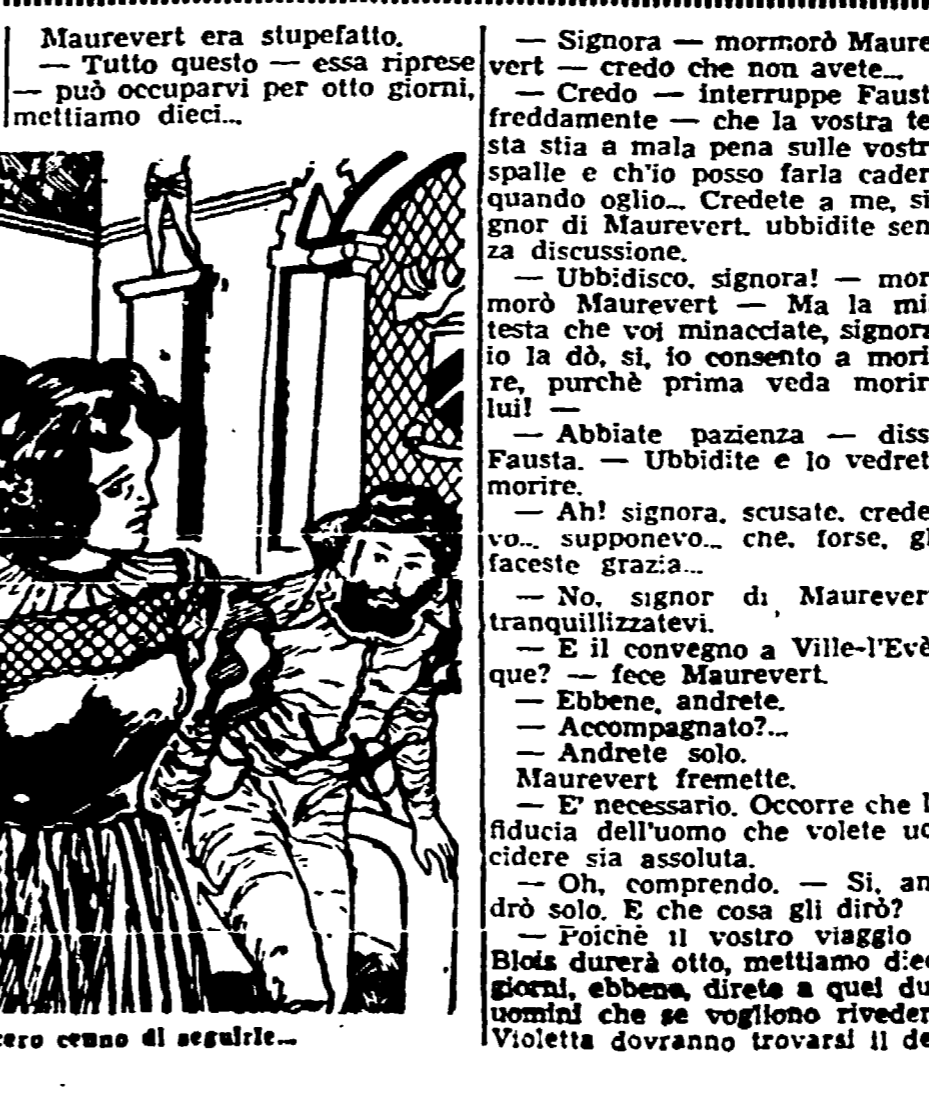
Myrtle e Lea gli fecero cenno di seguirle...

«Maurevert era stupefatto. Tutto questo - essa riprese - finalmente per otto giorni, mettiamo dieci...» «Signora - mormorò Maurevert - credo che non avete...»