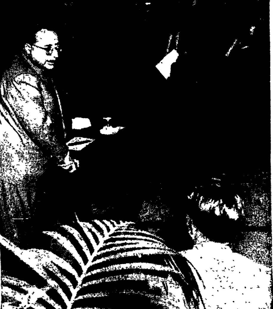
Un momento della conferenza stampa di Togliatti