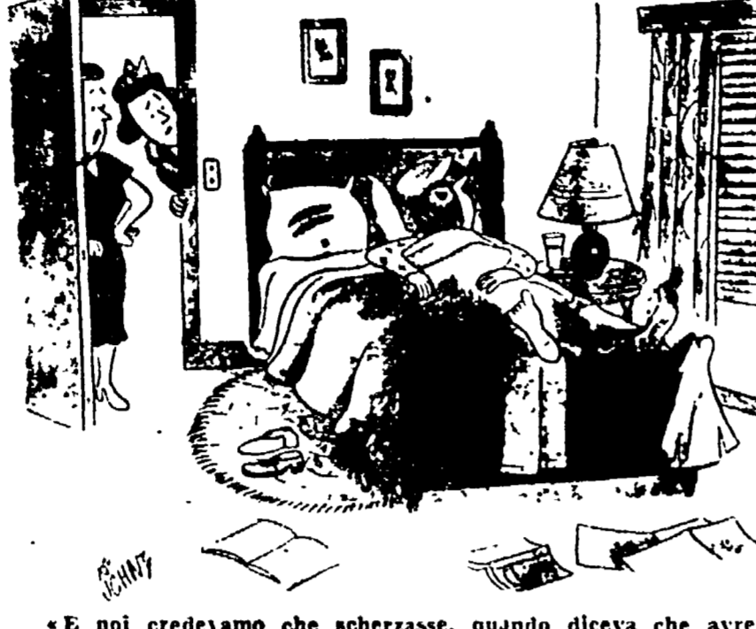
«E noi credevamo che scherzasse, quando diceva che avrebbe passato a letto i suoi quindici giorni di ferie...»