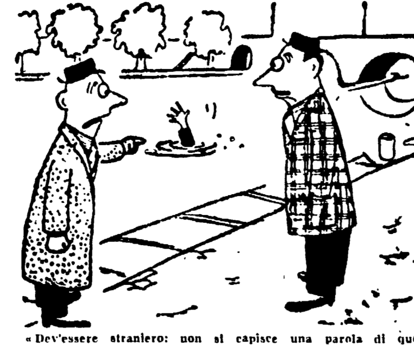
Dev'essere straniero: non si capisce una parola di quello che dice...