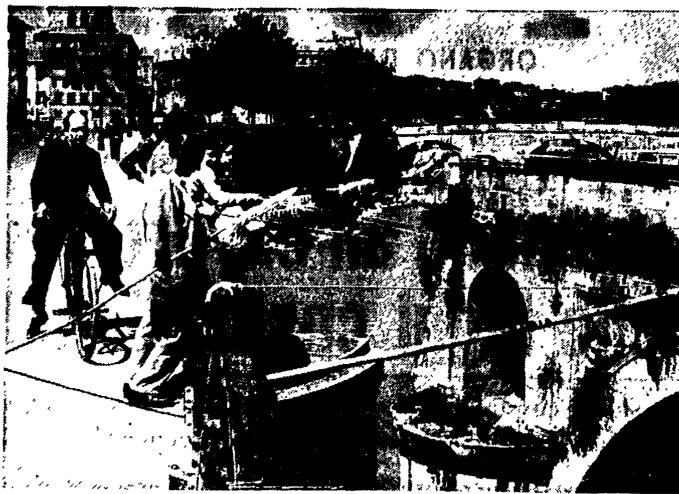
Non tutti possono permettersi il lusso di andare al mare per un po' di pesca e i lungotevere si prestano volentieri a sostituire le scogliere. I pescatori che conoscono noi cittadini non sono naturalmente quelli che badano alla qualità del pesce: si accontentano di fare dello sport.