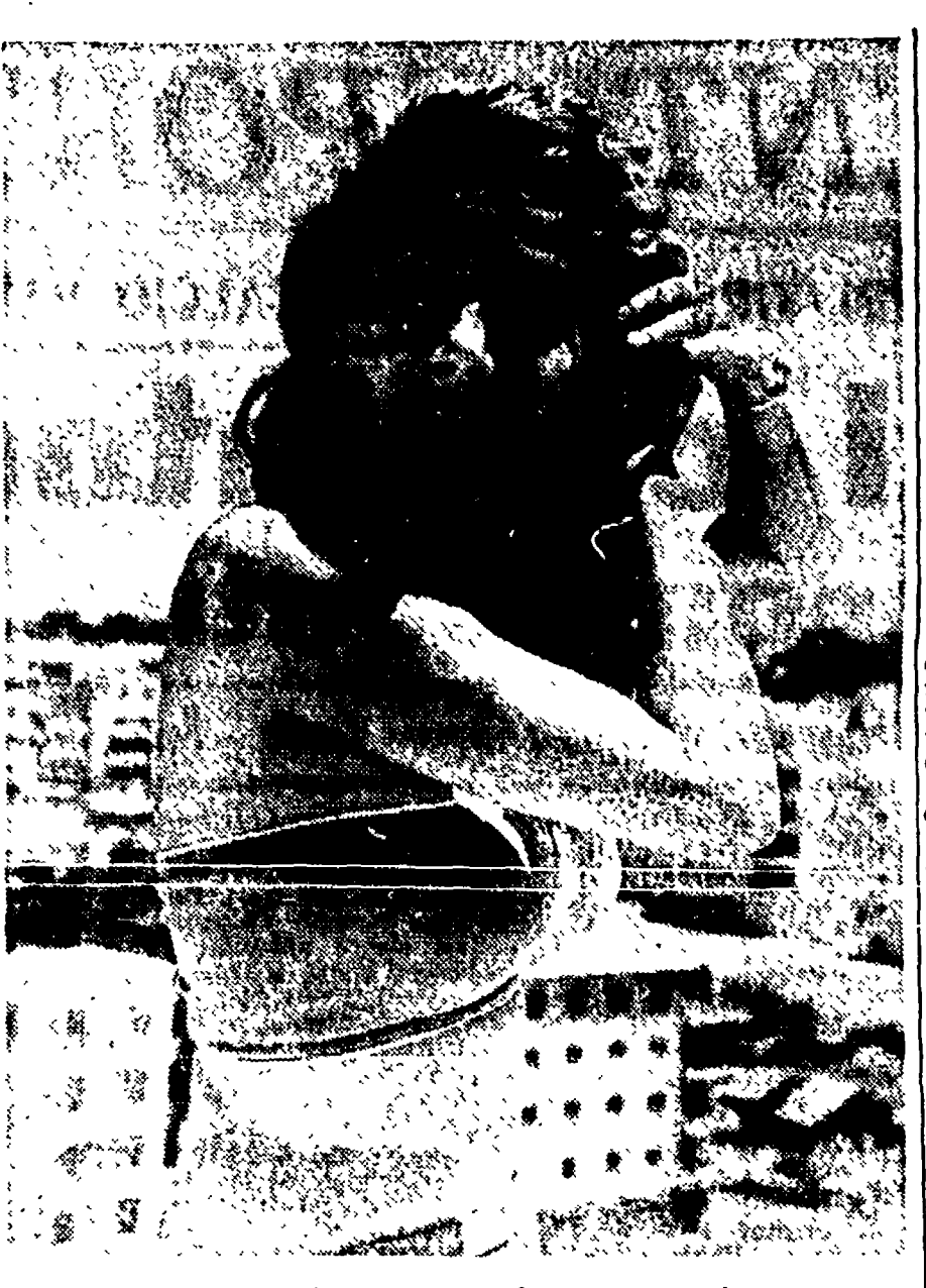
Tra un film e l'altro, Costella Greco si concede una breve vacanza domestica. Vedremo nella prossima stagione la graziosa attrice in «Fratelli d'Italia», l'ultimo film di Germi

La storia del COCOM venne fuori all'epoca della Conferenza Economica Internazionale di Mosca. I nostri ministri, La Malfa in testa, lanciarono apocalittiche minacce, tacciando di «antifunzionale» chiunque si fosse azzardato a parlarne. E invece si scoprì che gli antinazionali erano proprio loro, i ministri, i quali accettavano tranquillamente di dover subordinare ad un ufficio straniero (un ufficio americano con sede a Parigi) qualunque contratto di esportazione stipulato da industriali e commercianti italiani con un paese dell'est.