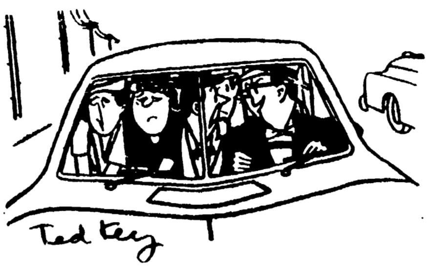
«E voi dicevate che questa macchina non poteva portarci tutti e otto, vero?...»