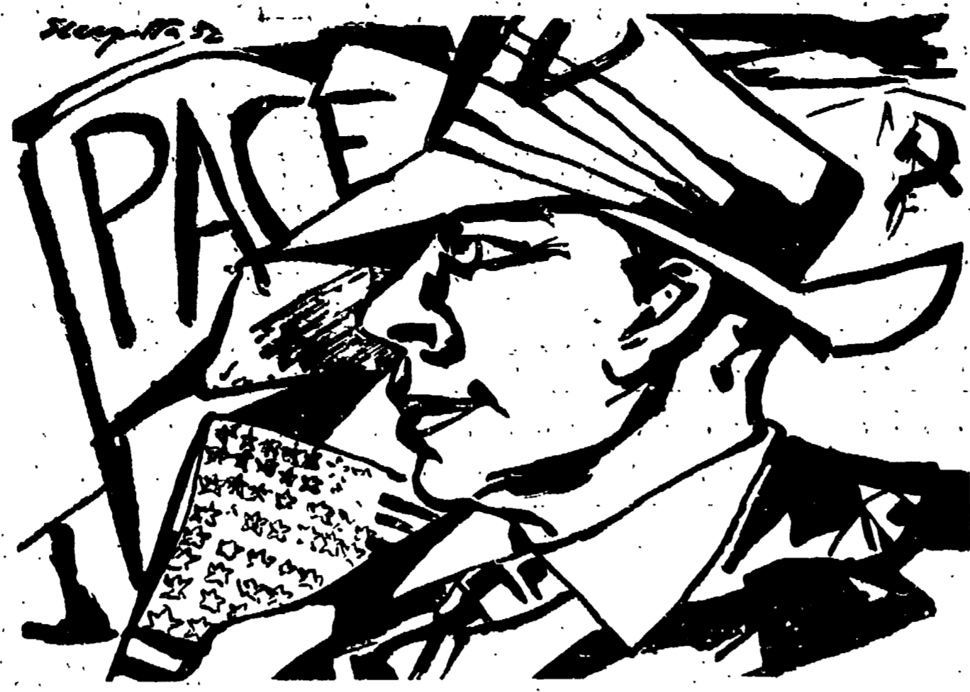
Dalle lucide scrivanie del tribunale di Pittsburgh, città di minatori, è stata comminata la più forte condanna finora voluta dall'isterismo di guerra negli S. U. contro un degno figlio del popolo americano.