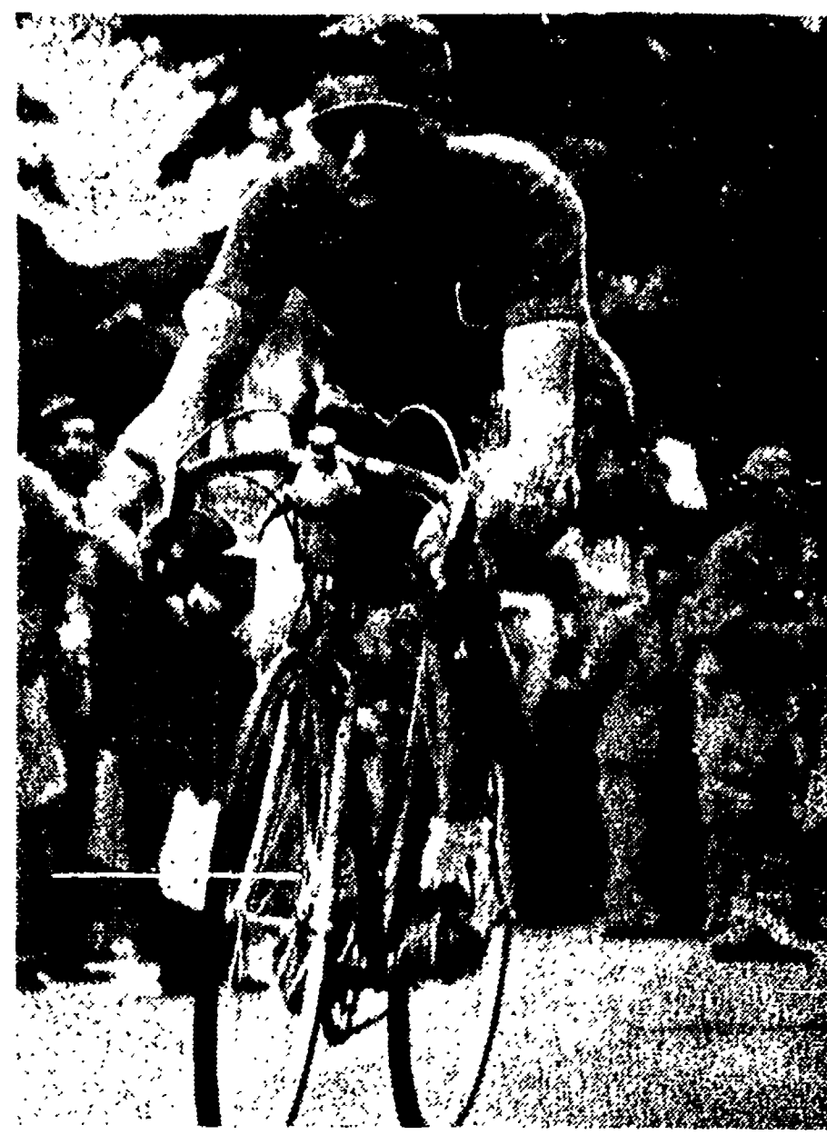
Toni è la punta d'oro della "freccia dell'Emilia"

Una paurosa caduta a due chilometri dal traguardo ha impedito a Bartali, a Petrucci ed a Magni di partecipare al "volatone finale., - Conterno è secondo