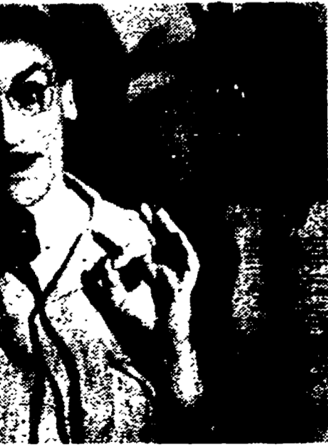
Una simpatica espressione di Eduardo De Filippo, nel film «Ragazzo da marito», che egli sta portando a termine in questi giorni