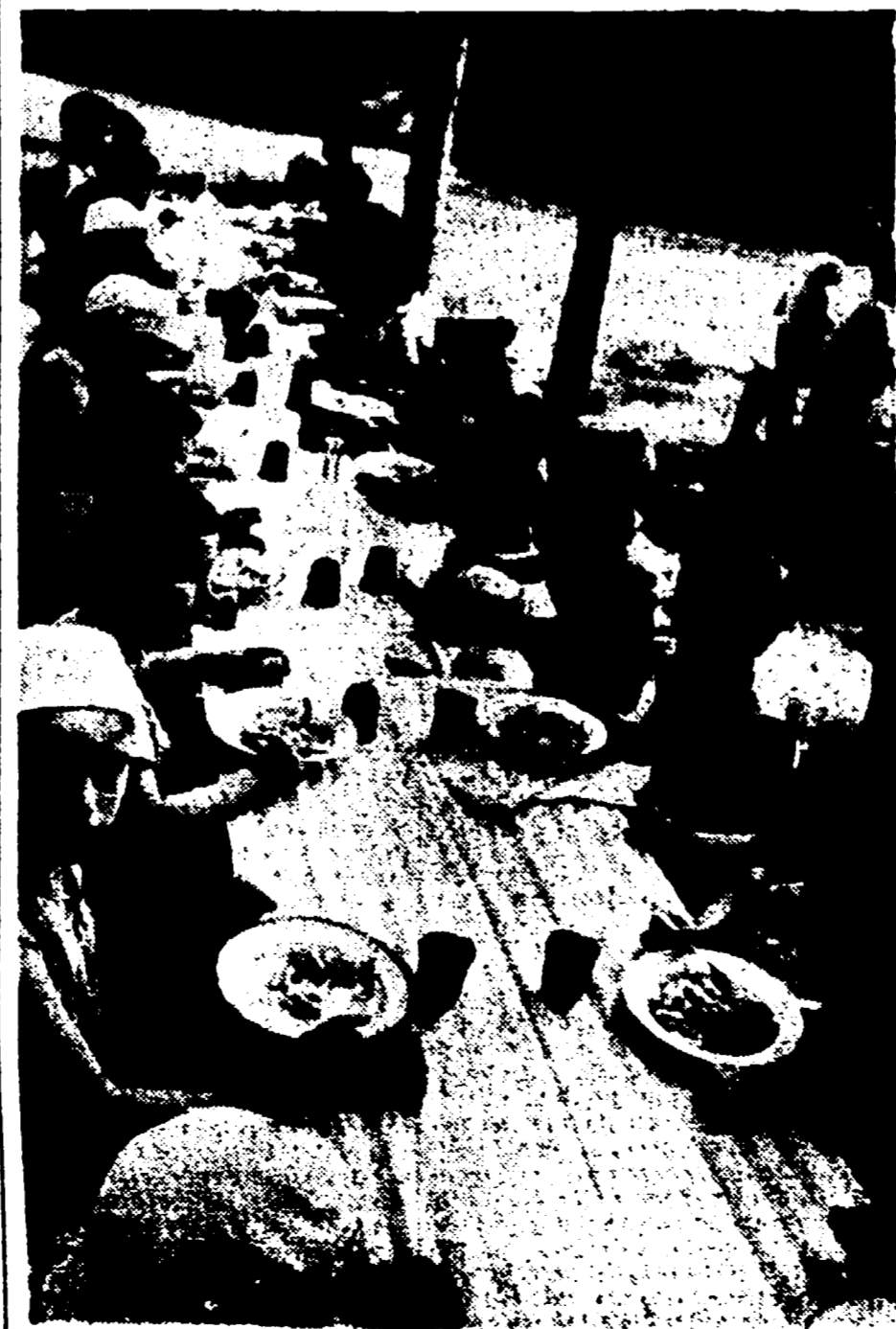
FIRENZE — Il prefetto di Firenze con un suo decreto ha ordinato la immediata chiusura della colonia elioterapica di Bivittoli, organizzata dal comune popolare di Empoli. Come previsto per il futuro provvedimento è stato preso la mancanza di un prete nell'organico del personale della colonia e di una attrezzatura per le funzioni religiose. Nella foto: un gruppo dei piccoli ospiti della colonia mentre consuma con appetito il pasto di mezzogiorno

nostra manifestazione, ed essa è che noi festeggiamo insieme l'atto gradito di maturità del movimento operaio. Così la storia di un uomo è la storia del movimento dei lavoratori italiani, delle loro lotte, delle loro battaglie, della giornata di ottimismo del riconoscimento dello sciopero come diritto costituzionale, dopo aver illustrato il suo passaggio dal socialismo utopistico al socialismo scientifico, sulla base degli insegnamenti della « deologia marxista », sulla base degli insegnamenti di Antonio Gramsci e di Palmiro Togliatti. Di Vittorio accenna alla formazione della cultura della classe operaia e del popolo lavoratore, di cui egli è l'espressione: il nostro umanesimo che si realizza, realizzando la nuova intelligenza, la nuova forza dirigente di tutto il paese. Il discorso di Di Vittorio, nobilito, commosso, trascinato, conclude con un grande appello all'unità sindacale. La manifestazione è chiusa e tutto il teatro tributa a Di Vittorio una grande ovazione. Il suo discorso, che ha commosso ed entusiasmato da tutti sarà a lungo ricordato. E' un episodio della storia del movimento operaio, è un episodio della storia del nostro paese. Da tutto il mondo i lavoratori hanno inviato telegrammi e il loro saluto entusiastico ed affettuoso a Giuseppe Di Vittorio, dai sindacati sovietici, cinesi, indiani, belgi, olandesi, sud-americani, statunitensi, rumeni, polacchi e di ogni paese del mondo.