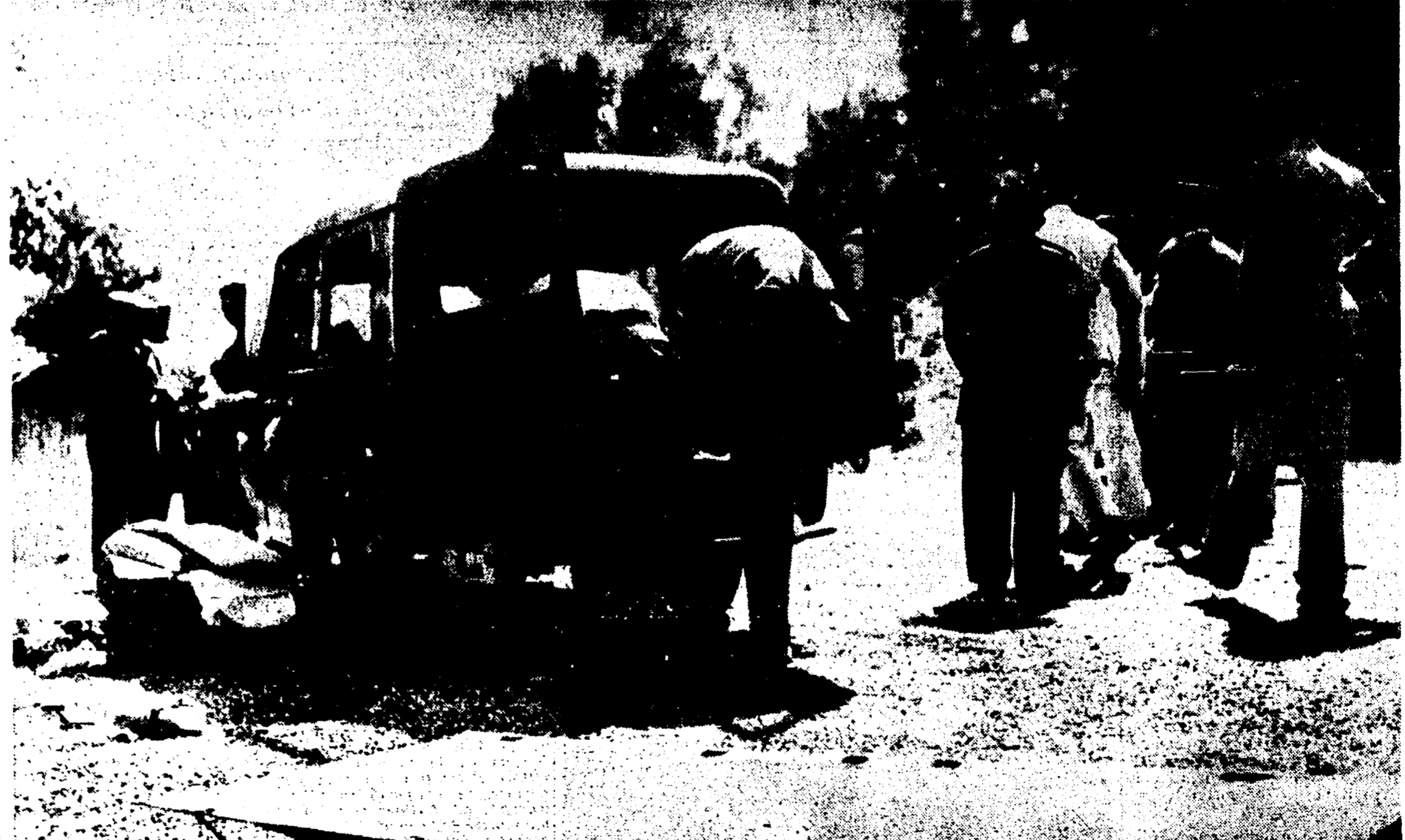
L'auto che trasportava sir Jack Drummond e la famiglia, assassinati da sconosciuti, ispezionata accuratamente dalla polizia locale e dagli agenti della Sureté

REVOCARRE IL CRIMINALE ORDINE DI BASCUS!