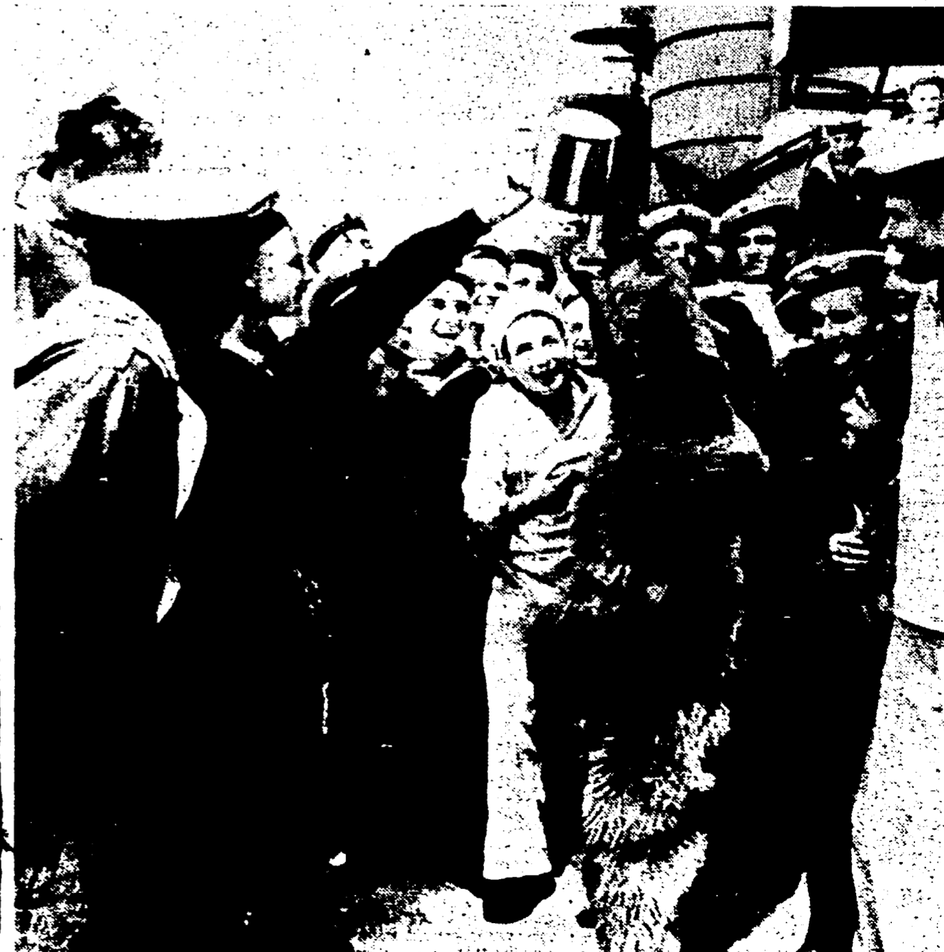
MOSCA. — Una « mascotte » d'eccezione in una nave da guerra della Marina sovietica: un orso di notevoli proporzioni che alletta con i suoi scherzi l'equipaggio. Eccolo mentre consuma la colazione

PIETRO INGRAO - Direttore Piero Clementi - Vice direttore resp. Stabilimento Tipografico D.E.S.I.S.A. ROMA - Via IV Novembre 149