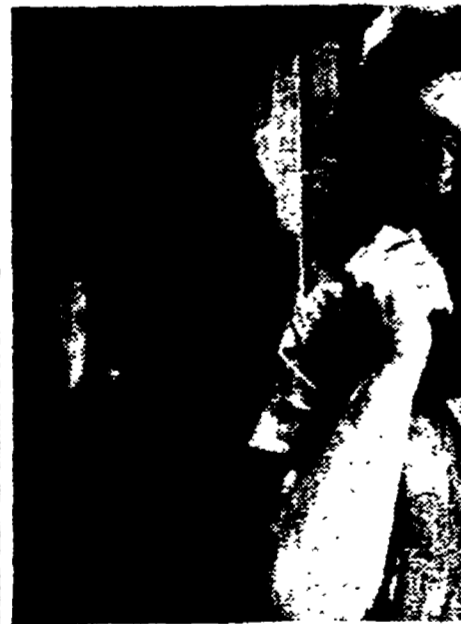
Una simpatica espressione di Eduardo De Filippo, nel film «Ragazzo da marito», che egli sta portando a termine in questi giorni

I risultati sono eccezionali, tanto da far dire a questa fiamma d'arte moderna e artigianato antico, che da immediatamente i suoi frutti economici, che richiama pubblico ed acquirenti, che genera un solo «venice», un «bisogno di imparare qui che cosa fosse, in una minuziosa analisi figurativa. Bastava che esse si trovasse una scarna, un'emozione religiosa, è al corrente dell'istruzione del Sant'Uffizio. Mi dice di sì, ne ha letto sulla Croix, l'organo cattolico francese. Ma è un discorso che fa chiudere in un risentimento, una concessione. «Ritarderà la Cappella quest'istruzione? Non credo — mi dice con un sorriso appena accennato — se non, forse, per il quarantennale della Vergine». Una risposta, una concessione. E poi di nuovo ad alta voce, un elogio dell'arte di Matisse, della sua opera che ha portato una celebrità, certo troppo scomoda, alla comunità delle domenicane di Venecia.