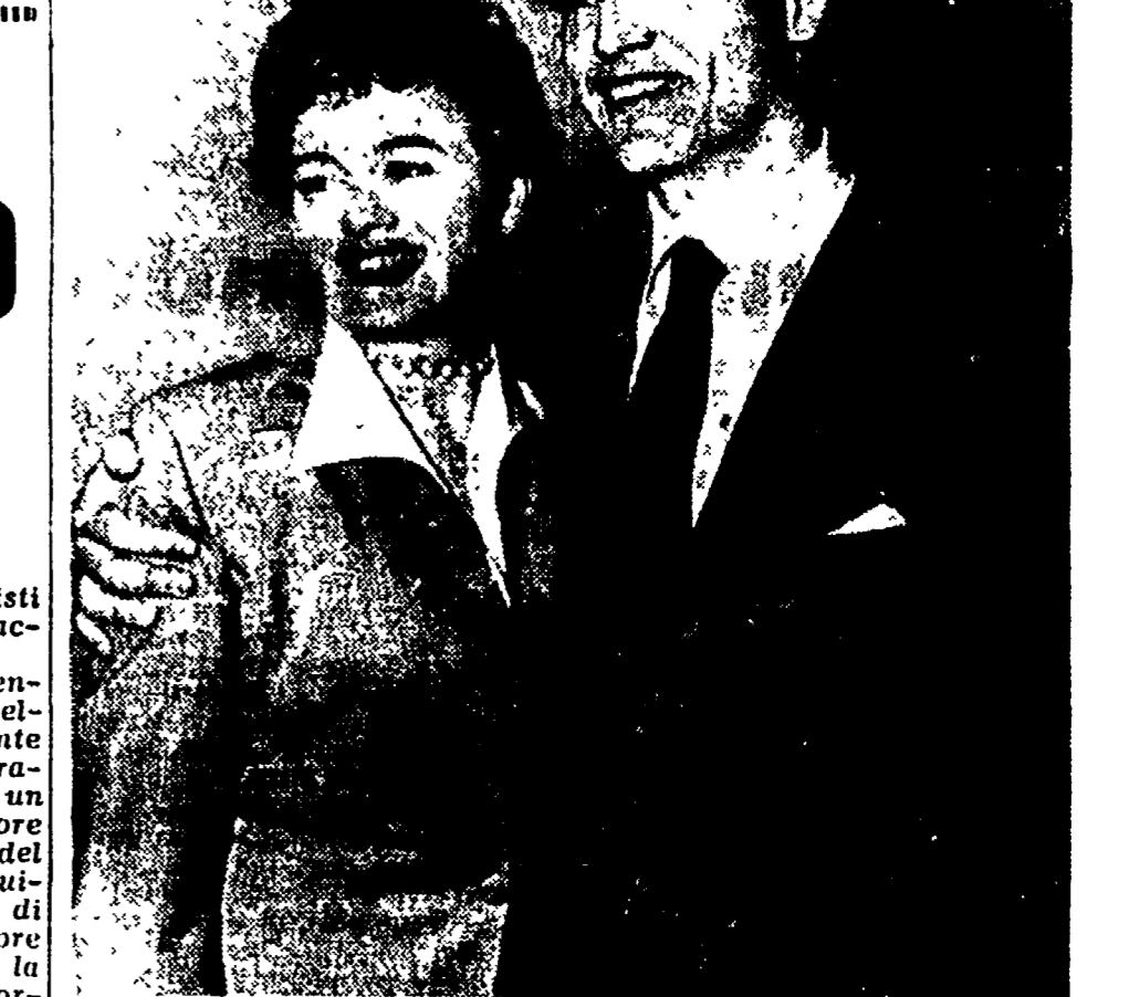
Una recente foto di Vittorio Gassmann con sua moglie, l'attrice americana Shelley Winters, protagonista di «Un po' di sole»

« Come si chiamerà la tua formazione? — chiedono. »