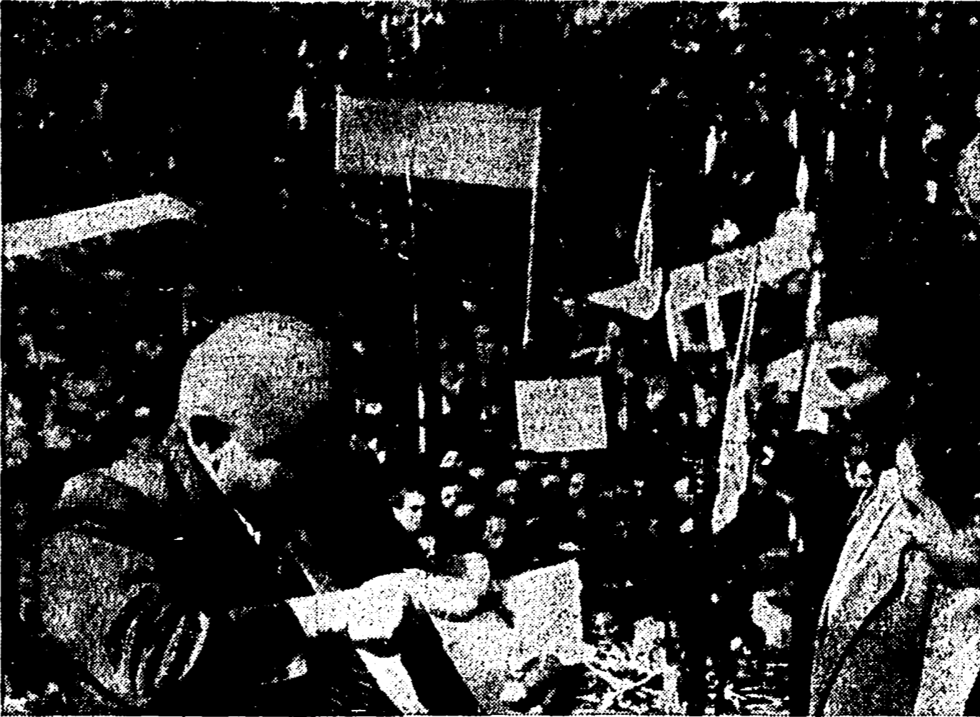
BUDAPEST — Il popolo ungherese celebra oggi, 20 agosto, il III anniversario della sua Costituzione che segna la nascita della democrazia popolare e sancisce l'impegno dell'edificazione socialista. Nella fotografia: il 20 agosto 1949, Mattia Rakosi presenzia alle manifestazioni nella « giornata del nuovo pane »