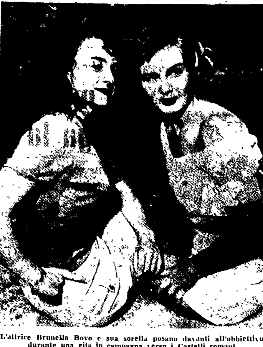
L'attrice Brunella Bovo e sua sorella posano davanti all'obiettivo durante una gita in campagna verso i Castelli romani

I giornali uscivano sempre a sei pagine, non contenendo la legge nessuna diminuzione per la carta, ma erano stampati una pagina sì e una pagina no. Gli scrittori scrivevano romanzi tutti con le lettere maiuscole e le persone pronunciavano le parole con un suono un po' più lungo.