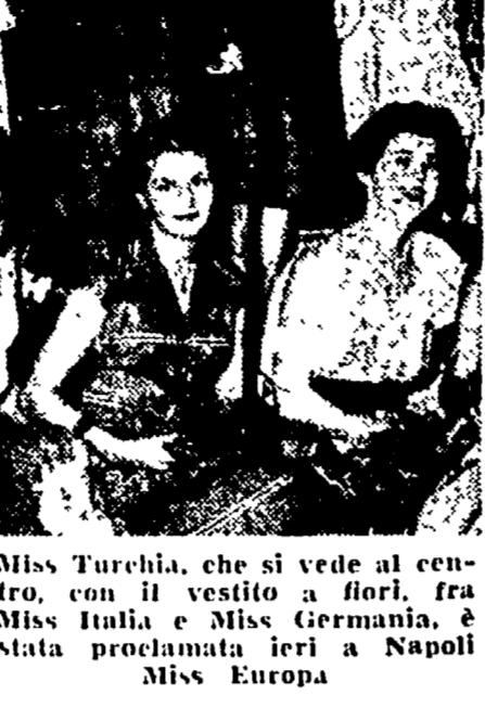
Miss Turchia, che si vede al centro, con il vestito a fiori, tra Miss Italia e Miss Germania, è stata proclamata ieri a Napoli Miss Europa.

Scandalose manovre di esponenti della CISL per favorire i disegni dell'Ente del Fucino