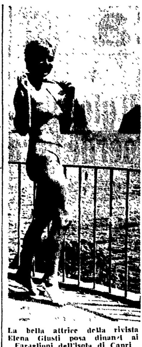
La bella attrice della rivista Elena Gluski posa dinanzi ai Frangioni dell'Isola di Capri