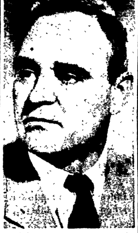
Qui il popolo rumeno festeggia l'anniversario al suo Presidente del Consiglio, Gheorghiu Dej, l'ottavo anniversario della liberazione del Paese da parte dell'Armata Rossa