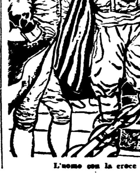
L'uomo con la croce di S. Luigi chinò la testa...