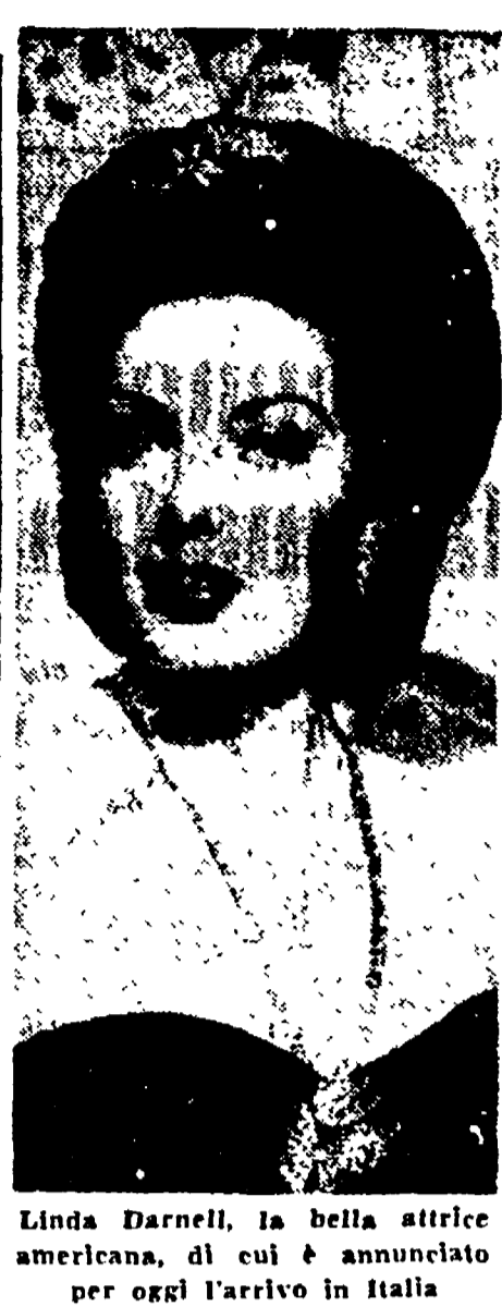
Linda Darnell, la bella attrice americana, di cui è annunciato il ruolo per ogni l'arrivo in Italia.