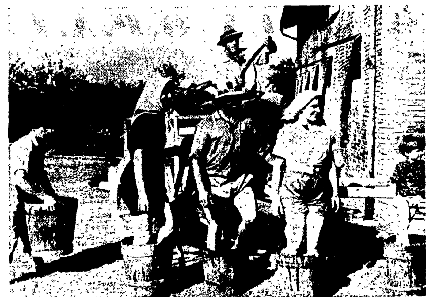
L'immagine della pigiatura nelle terre del Chianti. La crisi del vino in Toscana ha raggiunto una punta massima, dovuta all'impossibilità di consumo da parte dei lavoratori e all'adulterazione dei vini più famosi in Italia e all'estero.

tempi sono tali (quanto vino viene sofisticato?) che noi quasi siamo portati a non credere più alle virtù dell'oro potabile o, se volete, del «calore del sole fatto liquido».