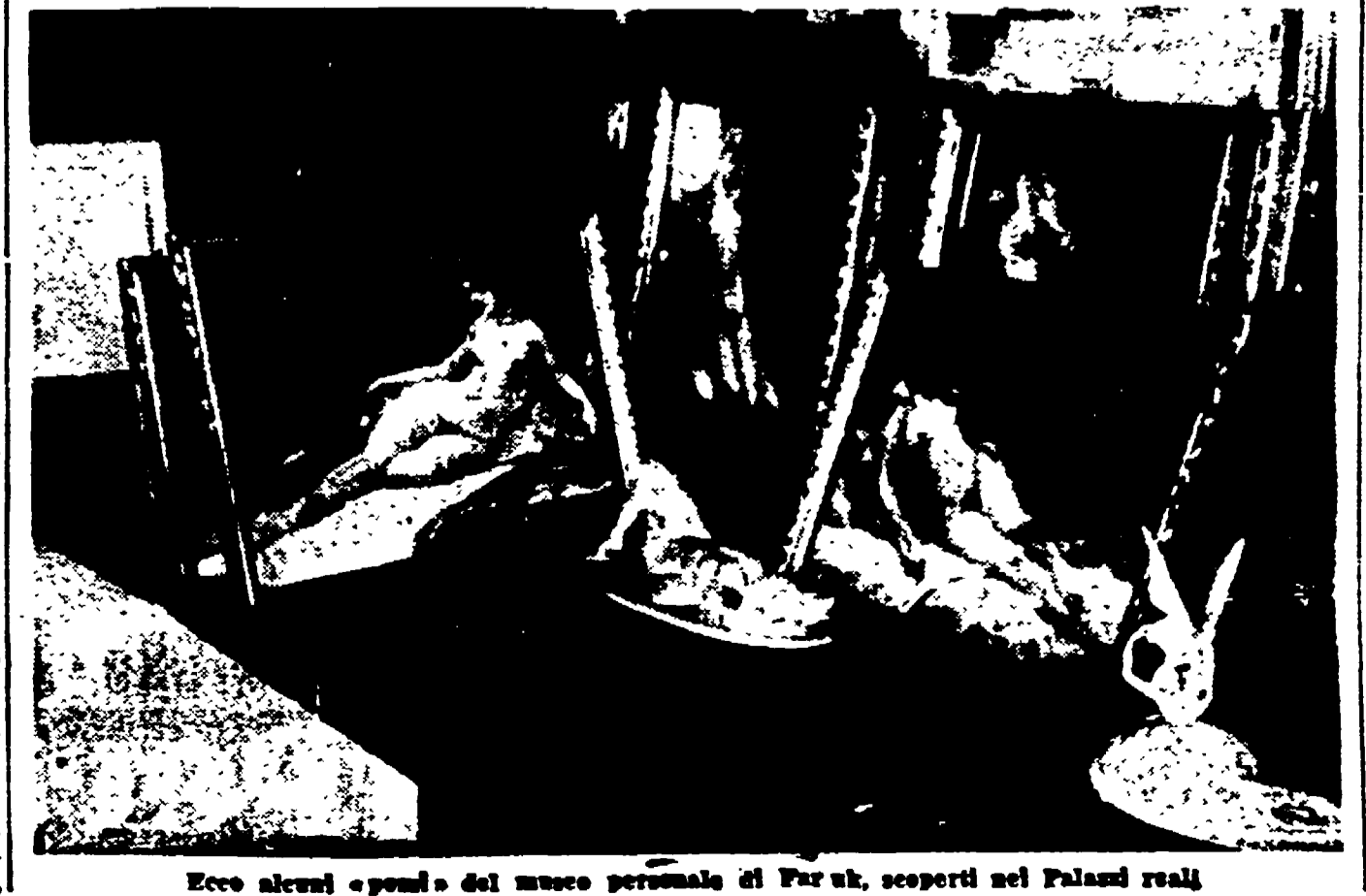
Ecco alcuni «opoli» del museo personale di Faruk, scoperti nel Palazzo reale