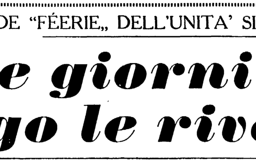
Una rassegna del lavoro al Parco Michelotti - Diecine di stand multicolori Dodicimila razioni di tortellini sono giunte da Bologna - Balli, cori e film