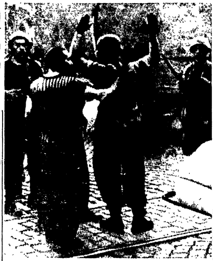
Centinaia di episodi commoventi ed eroici contrassegnavano la storica giornata dell'8 settembre 1943. In numerose città uomini di ogni ceto si unirono ai soldati italiani...