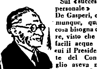
Tempesta a Strasburgo