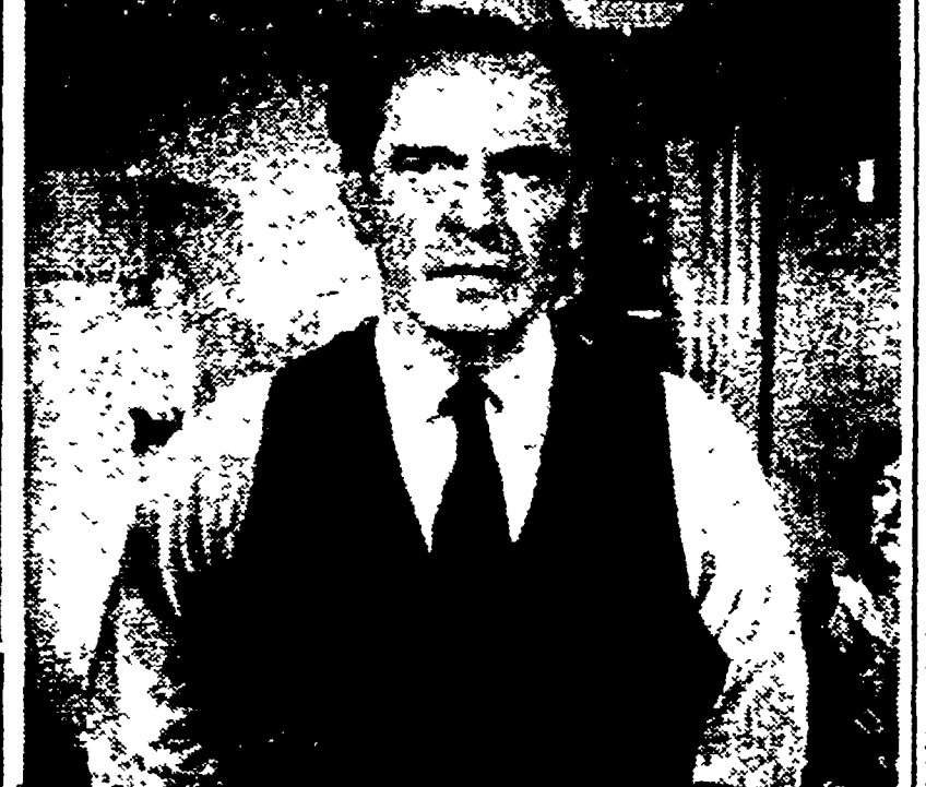
Fredrich March, che ha avuto il premio per il miglior attore

Aspetto inoffensivo del bacillo - Un'azione fulminea - I mezzi per combattere il male - Soprattutto prudenza