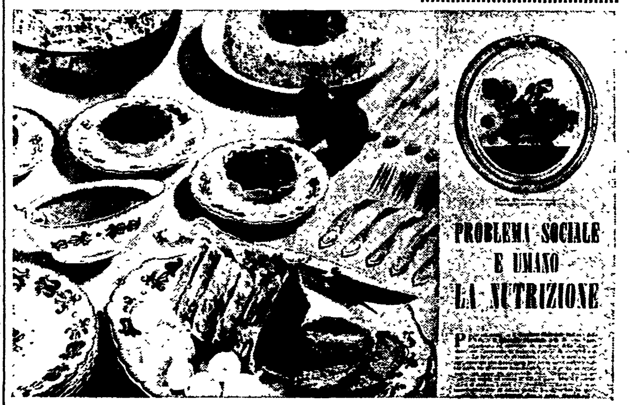
Con queste immagini paradisiache la rivista « Agricoltura », edita dal Ministero onomino, pretende di impostare e risolvere il problema sociale e umano della nutrizione