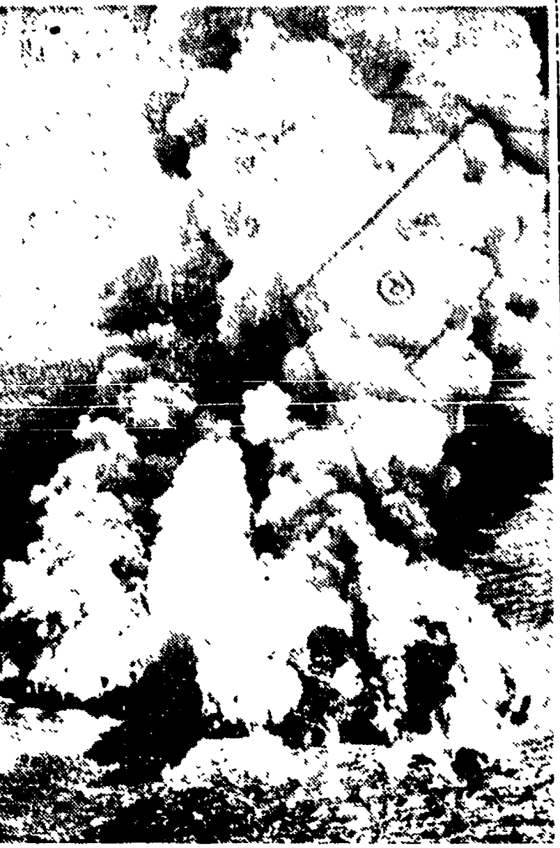
Una nuova isola è emersa, in Giappone, per una eruzione sottomarina

La stampa di Berlino occidentale, tranne l'americana Neue Zeitung, che non pubblica una sola riga sul caso Kennan si è chiesta stamane, se il governo socialista esigerà il richiamo dell'ambasciatore, come persona non gradita. La questione però è oggi piuttosto di sapere se, oltre a Kennan, il dipartimento di Stato non riterrà opportuno far ricattare il suo rannoccolato, come fece già con l'ambasciatore generale G. W. Kennan: si trova a Mosca soltanto dal marzo scorso, quan-