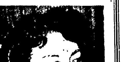
Dopo anni di compromessi, la protagonista di « Wanda, la peccatrice » dubita della propria felicità. Ecco una trepidante espressione di Yvonne Sanson in una scena del film

Istituto d'ISTRUZIONE « FEVOLA » Specializzato per recupero di anni e salti di classe Roma - Via F. Massimo 72 Tel. 32.947 Corsi intermediterranei, pomeridiani, serali d'istruzione Media, Classica, Scientifica, Industriale, Tecnica. - Avvicinamento Commerciale. - Computist! Steno-Dattilografia Segreteria 8-12 - 13-21