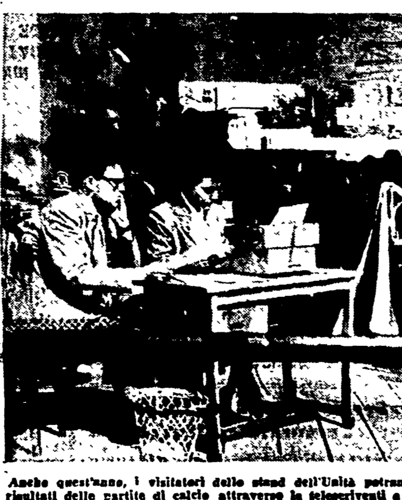
Anche quest'anno, i visitatori dello stand dell'Unità potranno conoscere tempestivamente i risultati delle elezioni del partito di calcio attraverso la televisione e la «edizioni straordinarie»

DALLE 19.50 IN POI In tutti gli stands di tutti i villaggi: orchestre da ballo, canzoni, spettacoli vari, recite e balletti di bambini.