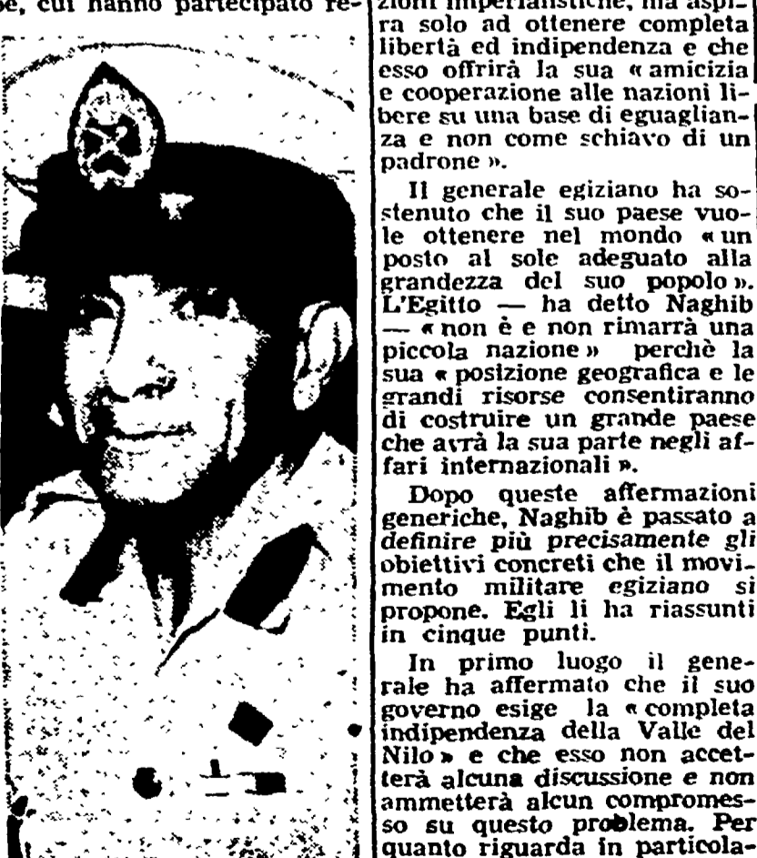
Naghib parti di fanteria corazzata, di cavalleria, del corpo cammelleri, mentre squadriglie di aerei e reazioni solcavano il cielo, e un elicottero lanciava sulla folla ritratti del generale. Dopo la sfilata, il generale ha pronunciato davanti alla folla e alle truppe radunate nella piazza Khedive Ismail - ribattezzata « Piazza della Libertà » - e alla presenza del Corpo diplomatico, un discorso che era stato pronunciato con grande solennità e che è stato radiodiffuso in tutto il paese.