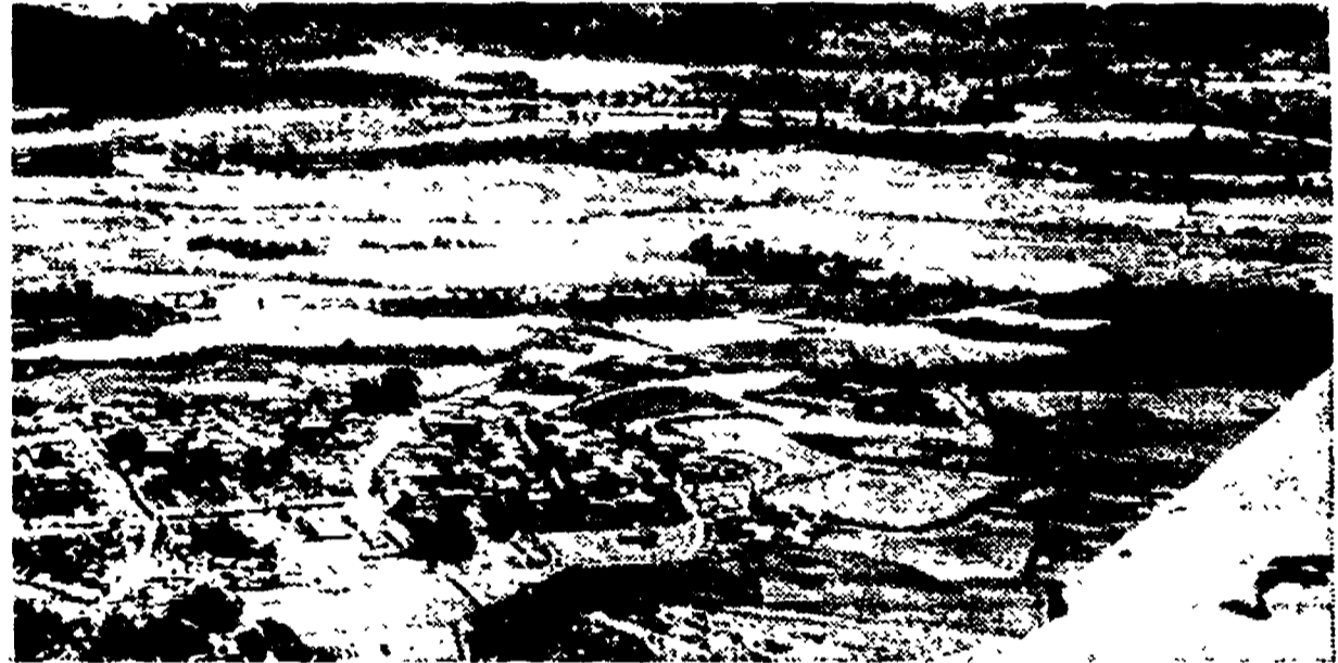
La piazzaforte di Nghia-lo, fotografata durante le ultime fasi dei combattimenti da un aereo francese carico di paracadutisti da gettare in aiuto della guarnigione.

Moch auspica un accordo a quattro per la Germania