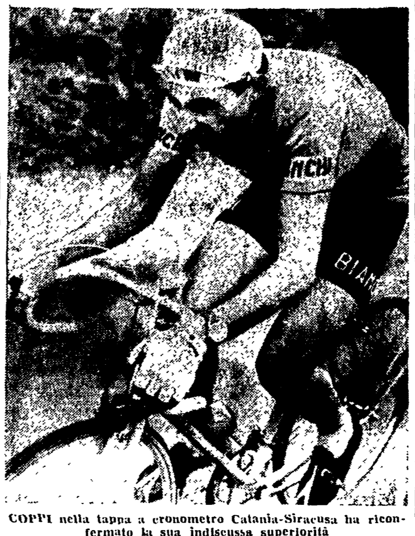
COPPI nella tappa a cronometro Catania-Siracusa ha riconfermato la sua indiscussa superiorità

LE PARTITE DI CALCIO COSTANO TROPPO Ridurre il prezzo dei biglietti per i giovani sino a venti anni