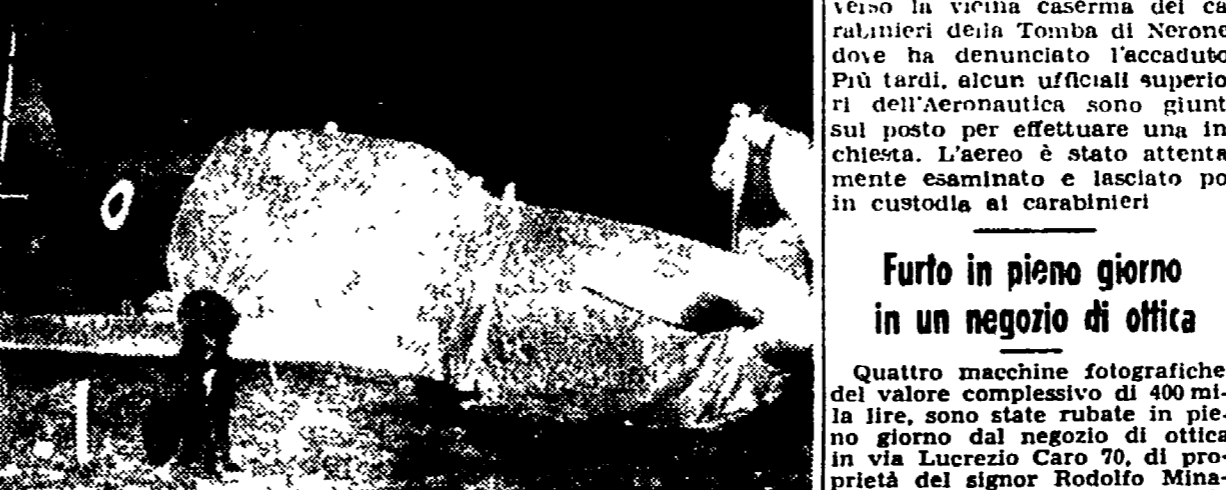
Un apparecchio dell'Aeronautica militare «Sestini Marchetti» è stato costretto ieri ad un atterraggio forzato su un vasto campo in località Involatella...

L'ala sinistra spezzata da un palo della luce - L'ufficiale pilota, rimasto illeso, è andato subito ad avvertire i carabinieri