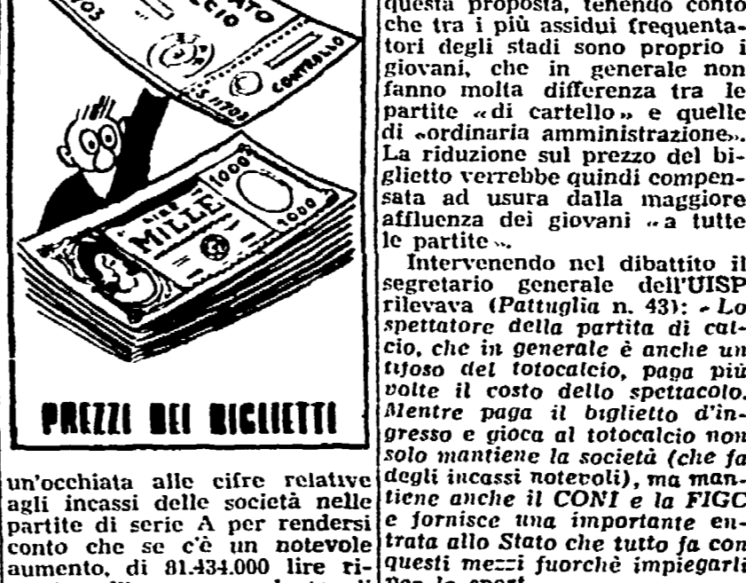
PREZZI DEI BIGLIETTI