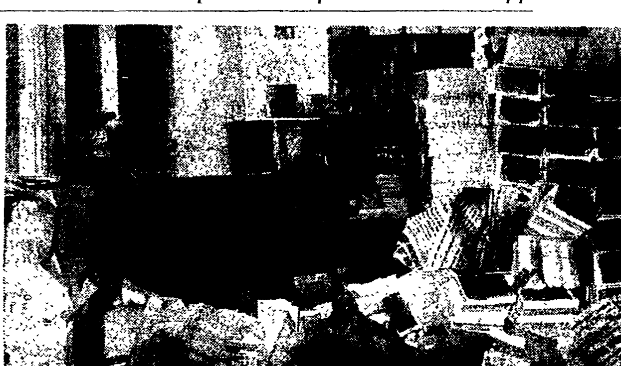
Ecco come è stata ridotta dalla polizia una delle stanze del Centro Diffusione Stampa del PCI dove giacevano i giornali murali sulla truffa elettorale

L'azione del governo per soffocare la protesta contro la legge elettorale truffaldina e per nascondere i trascorsi fascisti del deputato d.c. Tesouro che è il relatore socialista ieri in un goffo soprassunto poliziesco. Agenti di polizia, comandati dal capo dell'Ufficio politico della Questura, Imme, hanno fatto irruzione con la violenza nella sede del Centro Diffusione stampa del PCI, in via Quattroventi, e hanno sequestrato arbitrariamente alcune migliaia di esemplari di due giornali murali: il primo, intitolato « A legge fascista, recalcitrante » e il secondo, intitolato « Milioni di italiani negano la fiducia a De Gasperi » denunciando gli scopi della legge elettorale truffaldina, quello cioè di impedire che le perdite elettorali subite dalla D.C. si traducano, nella nuova Camera, in una perdita di deputati.