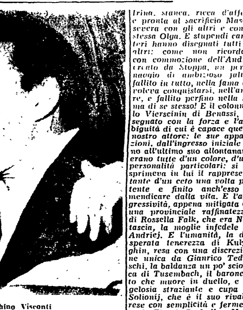
Il regista Luchino Visconti