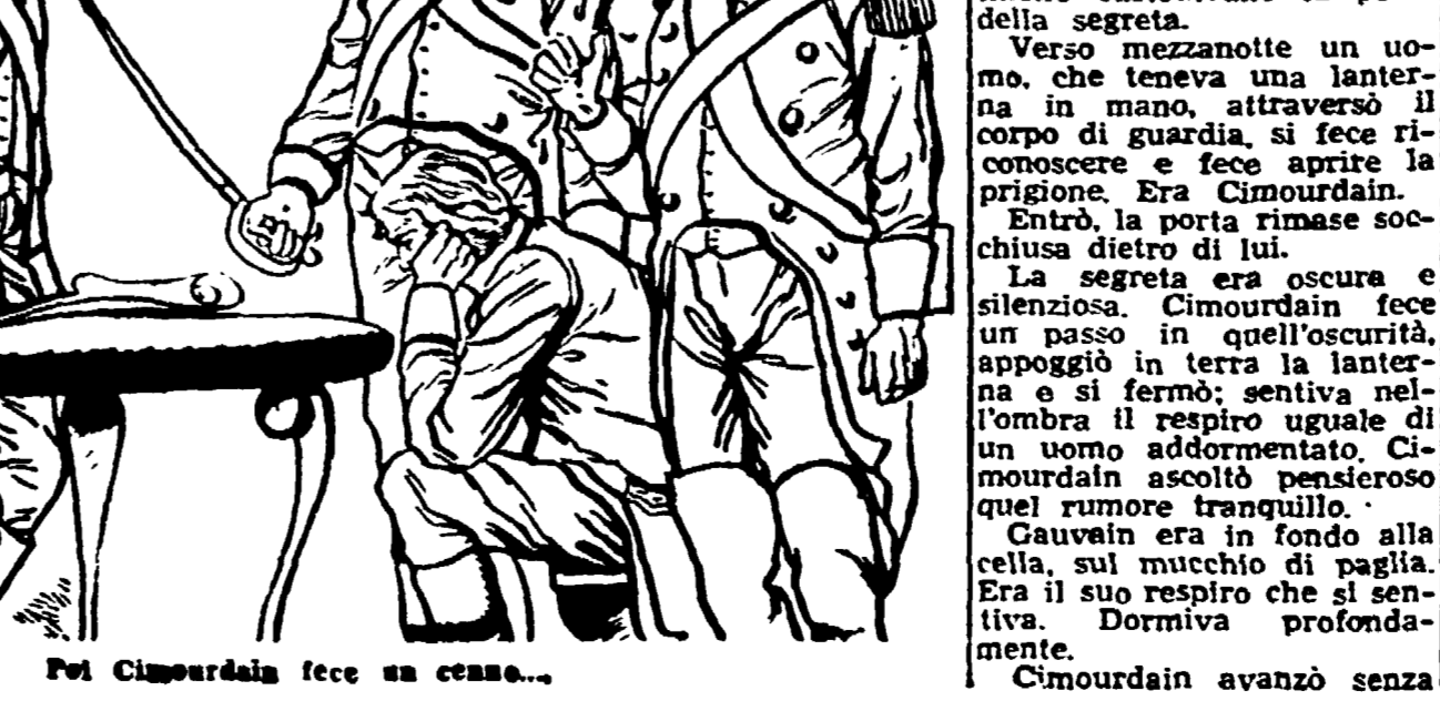
Poi Cimourdain fece un cenno...

rovunna da lui solo. Ciò che dipendeva da lui. Ciò che aveva fatto come giudice marziale, egli solo poteva distarlo come delegato civile. Egli solo poteva conce-