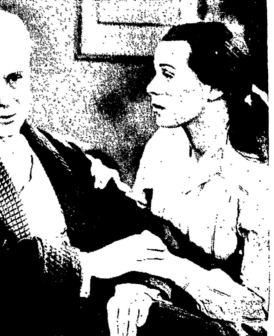
Charlie Chaplin e Claire Bloom in una patetica scena di «Luci della ribalta»